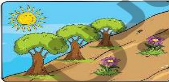
زمین شیب‌دار و پوشیده از گیاه