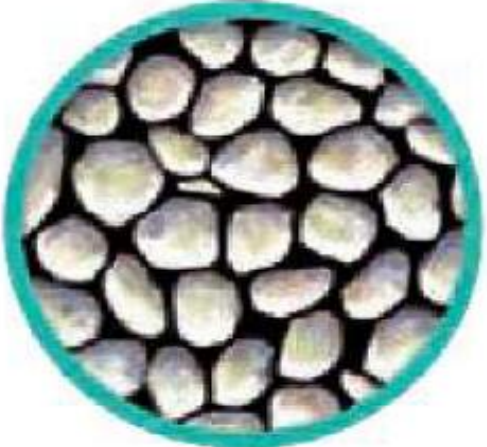
ماسه‌ی نرم (۲)