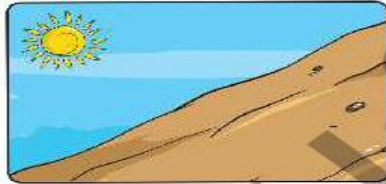
زمین شیب‌دار و بدون گیاه