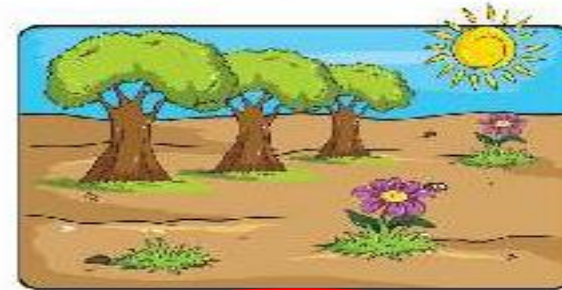
زمین صاف و پوشیده از گیاه

پوشش گیاهی باعث می‌شود آب بیشتر در زمین نفوذ کند.