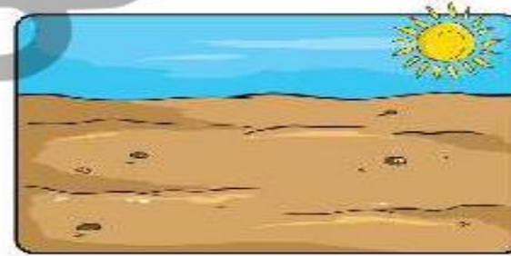
بیابان صاف و بدون گیاه