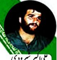
علی اکبر شیرودی

در این هنگام، نماینده ی گروه «همبستگی» گفت: «دوستان! ما فکر می کنیم چیزی که بیشتر از همه برای پاسداری از میهن لازم است، نکیه به قرآن و اسلام و پیروی از رهبر است که باعث اتحاد مردم می شود. ما اگر همیشه یاور هم باشیم و از خدای بزرگ یاری بجوئیم، موفق می شویم.» یکی از اعضای گروه «لاله» گفت: «ما می خواهیم درباره ی رزمندگان صحبت کنیم که در طول هشت سال دفاع مقدس، شجاعانه جنگیدند و از وطن دفاع کردند. شاید شما هم مانند من، دوست دارید در آینده خلبان شوید. بهتر است بدانید: خلبانانی مانند شهیدان عباس بابایی، مصطفی اردستانی، علی اکبر شیرودی، احمد کشوری و عباس دوران، دلاورانه پرواز کردند و میهن را حفظ کردند. آن ها اجازه ندادند حتی یک وجب از خاک میهن به دست دشمن بیفتد.»