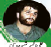
علی اکبر شیرودی

یکی از اعضای گروه «لار» گفت: «ما می‌خواهیم در باره‌ی دوستانگانی صحبت کنیم که در طول هشت سال دفاع مقدس، شجاعانه جنگیدند و از وطن دفاع کردند. شاید شما هم مانند من، دوست دارید در آئینه خلبان شوید. بهتر است بدانید: خلبانانی مانند شهیدان عباس بابایی، مصطفی اردستانی، علی اکبر شیرودی، احمد کشوری و عباس دورانی، دلاورانه پره از کردند و میهن ما حفظ کردند. آن‌ها اجازه ندادند حتی یک وجب از خاک میهن به دست دشمن بیفتد.»