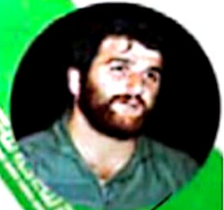
علی اکبر شیروودی

یکی از اعضای گروه «لاله» گفت: «ما می خواهیم درباره‌ی رزمندگان صحبت کنیم که در طول هشت سال دفاع مقدس، شجاعانه جنگیدند و از وطن دفاع کردند. شاید شما هم مانند من، دوست دارید در آینده خلبان شوید. بهتر است بدانید: خلبانانی مانند شهیدان عباس بابایی، مصطفی اردستانی، علی اکبر شیروودی، احمد کشوری و عباس دوران، دلاورانه پرواز کردند و میهن را حفظ کردند. آن‌ها اجازه ندادند حتی یک وجب از خاک میهن به دست دشمن بیفتد.»