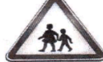
محل عبور دانش آموزان