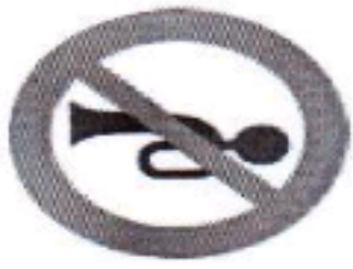
بوق زدن ممنوع

۵- هر یک از تابلوهای زیر چه نشانه‌ای هستند و چه پیامی برای ما دارند؟