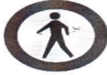
عبور عابر پیاده ممنوع