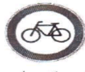
عبور دوچرخه سوار ممنوع