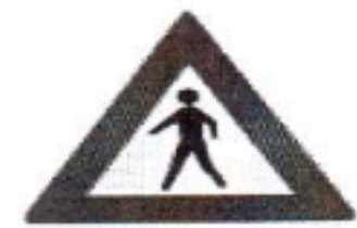
محل عبور عابر پیاده

۶- چراغ راهنمای عابرین پیاده چند رنگ دارد؟ و روشن شدن هر رنگ نشانه‌ی چیست؟