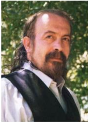
سید حسن حسینی

وی از شاعران و نویسندگان معاصر است و در دانشگاه تهران به تدریس اشتغال دارد.