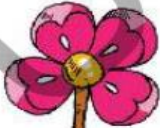
برگ پهن - ریشه راست

با توجه به تعداد گلبرگ‌ها، برگ و ریشه‌ی هر گل را بکشید.