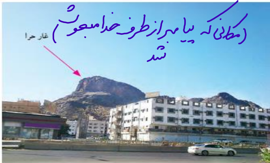
▲ منظره‌ی غار حرا در اطراف شهر مکه

مادر سارا گفت: «بچه‌ها، غار حرا نیز در نزدیکی شهر مکه قرار دارد و از مکان‌های مقدّس است. پیامبر گرامی اسلام، حضرت محمد (ص)، برای راز و نیاز با خدا به این غار می‌رفت. در همین غار بود که از طرف خداوند به پیامبری مبعوث شد.