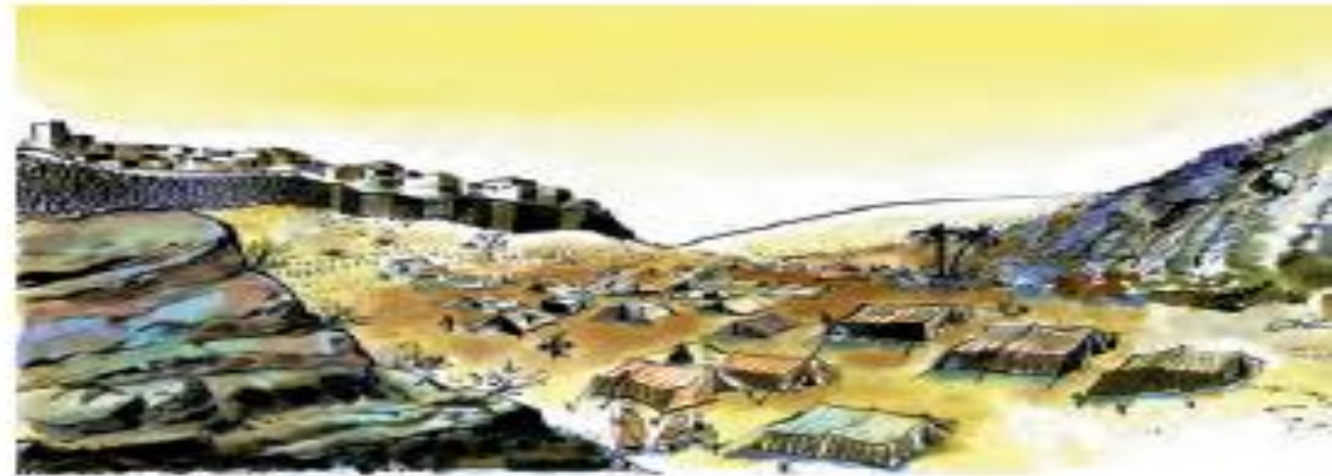
▲ تصویر شیب آب‌ی طالب در زمان محاصره