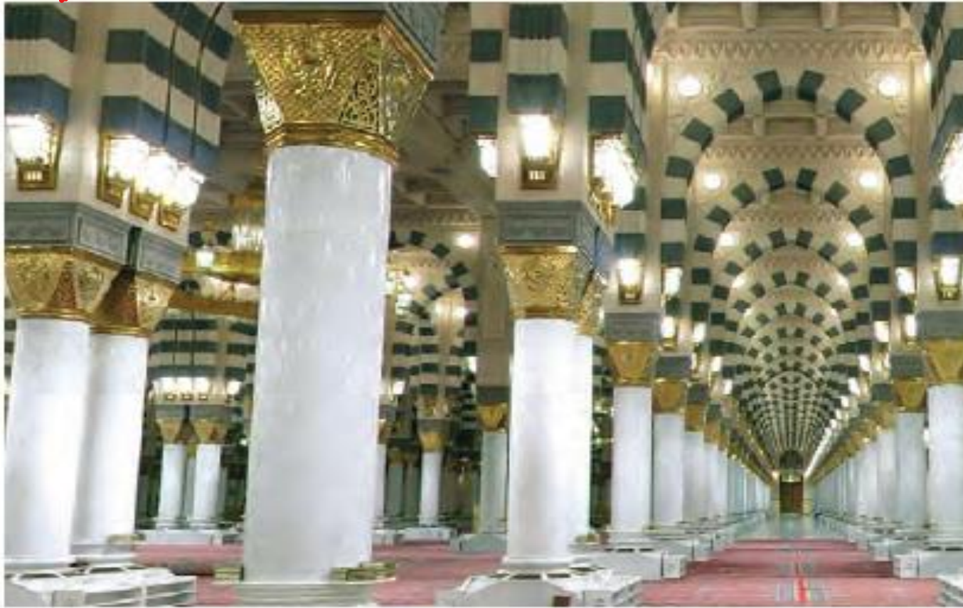
مسجد النبی، نمای داخلی