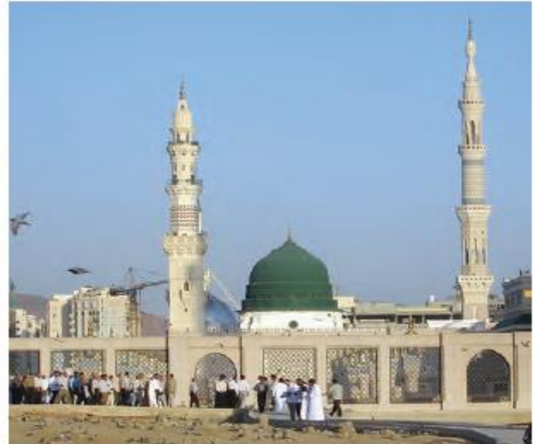
مسجد النبی، نمای بیرونی