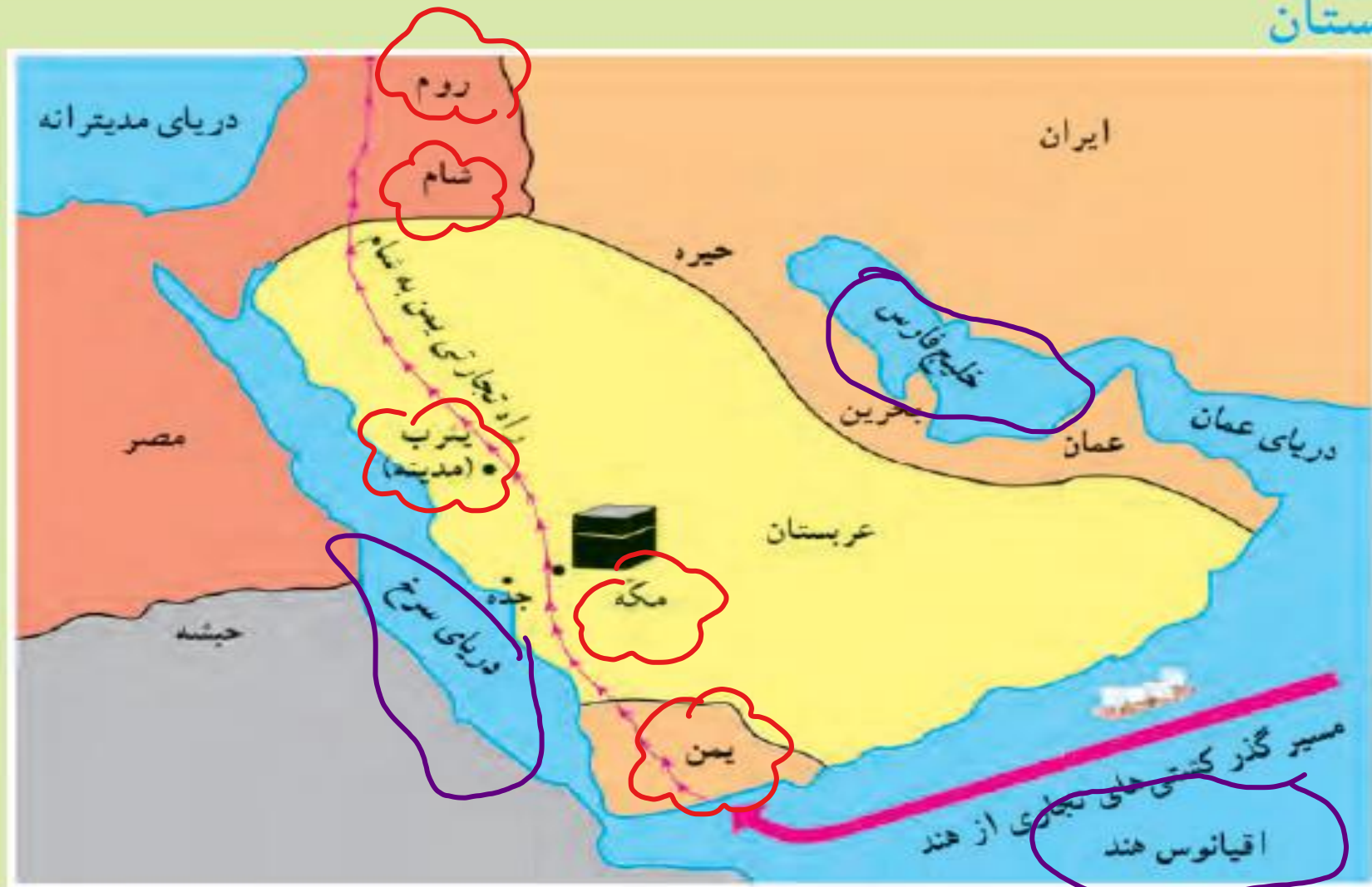
نقشه‌ی شماره‌ی ۱

به سرزمینی که از سه طرف به آب و از یک طرف به خشکی راه داشته باشد، شبه جزیره می‌گویند. در زمان ظهور اسلام، مهم‌ترین شهر عربستان مکه بود؛ زیرا این شهر بر سر راه کاروان‌های بازرگانی قرار داشت و خانهای کعبه نیز در آن جا بود.