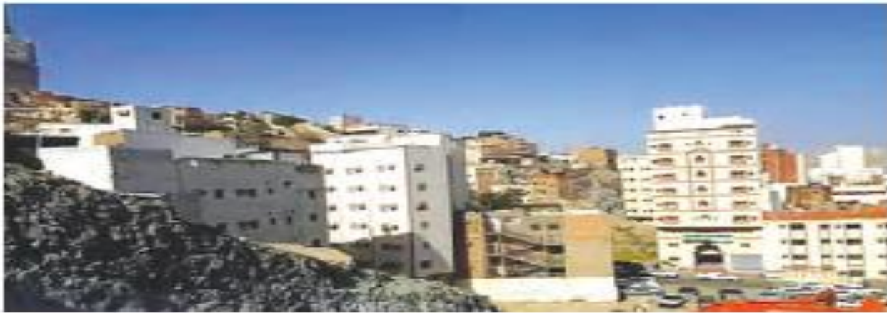
▲ شیب آب‌ی طالب در حال حاضر