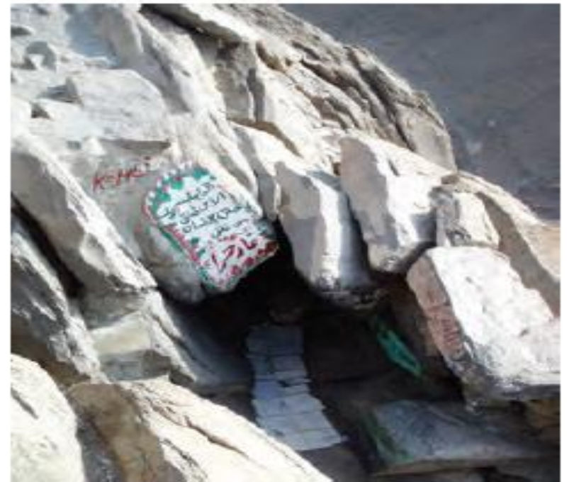
▲ غار حرا