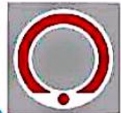
سازمان انتقال خون ایران