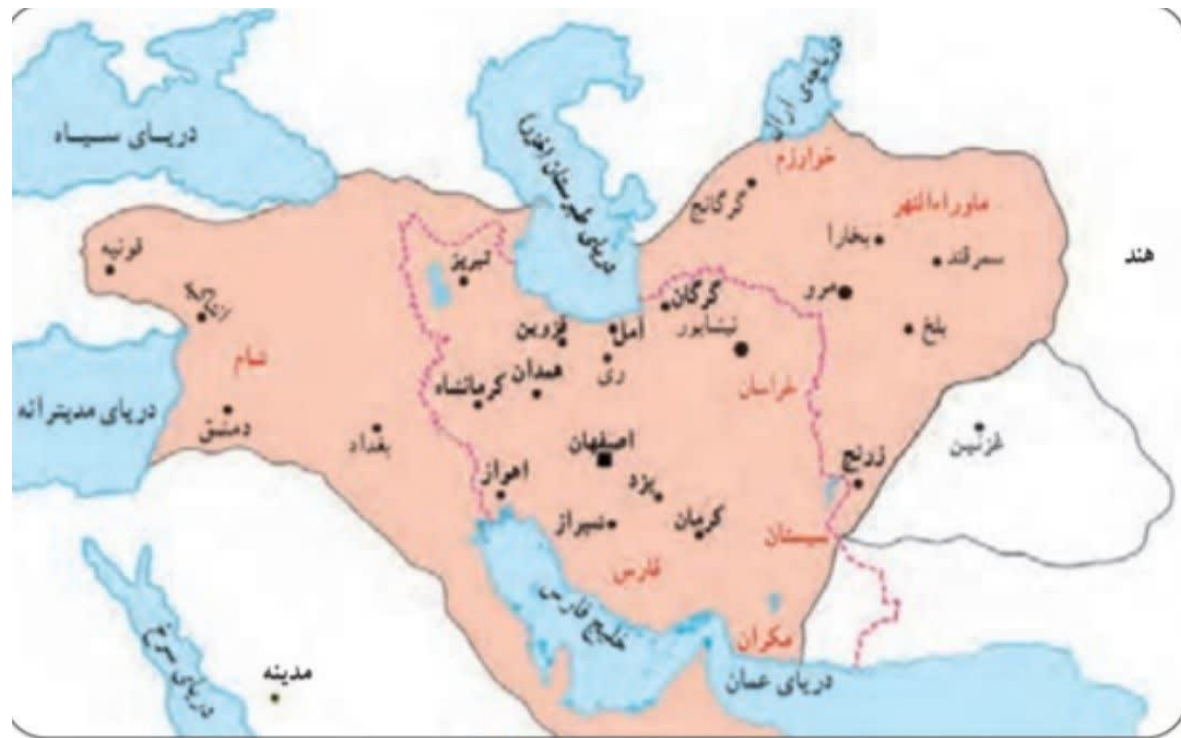
قلمرو سلجوقیان قلمرو غزنویان مرزهای ایران کنونی بایتخت