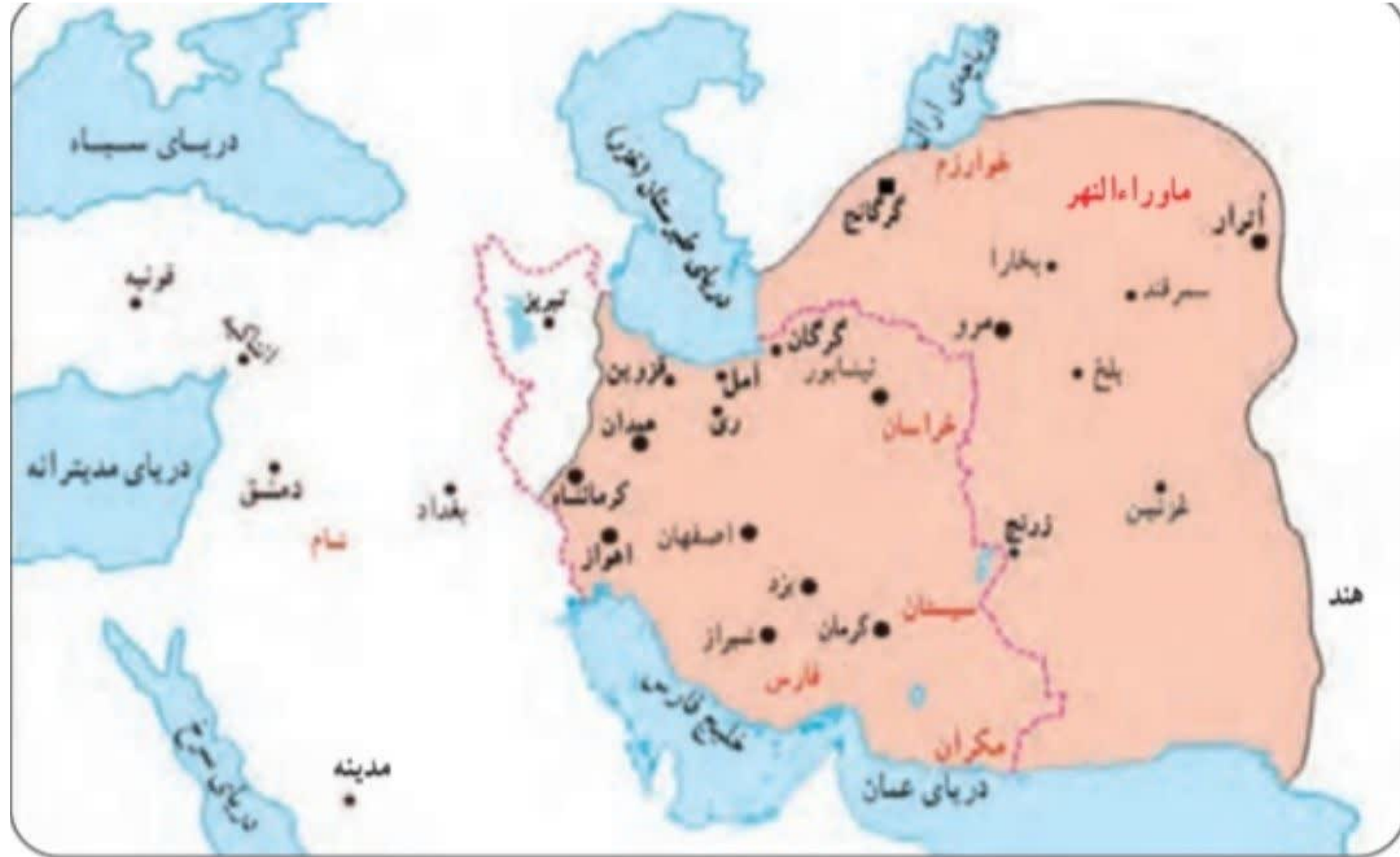
■ قلمرو خوارزمشاهیان --- مرزهای ایران کنونی ■ پایتخت