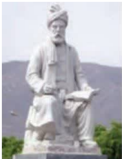
^ فردوسی شاعر بزرگ ایرانی

از جمله شاعران ایرانی معروف دوره‌ی غزنویان، ابوالقاسم فردوسی است. آیا نام اثر