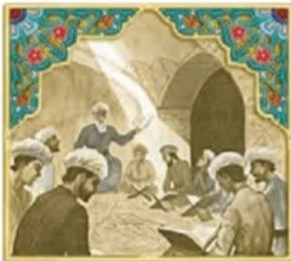
^ تصویر مدرسه‌ی نظامیه

● در دوره‌ی سلجوقیان، به دستور خواجه نظام‌الملک مدارس به نام «نظامیه» در شهرهای بزرگ ساخته شد.