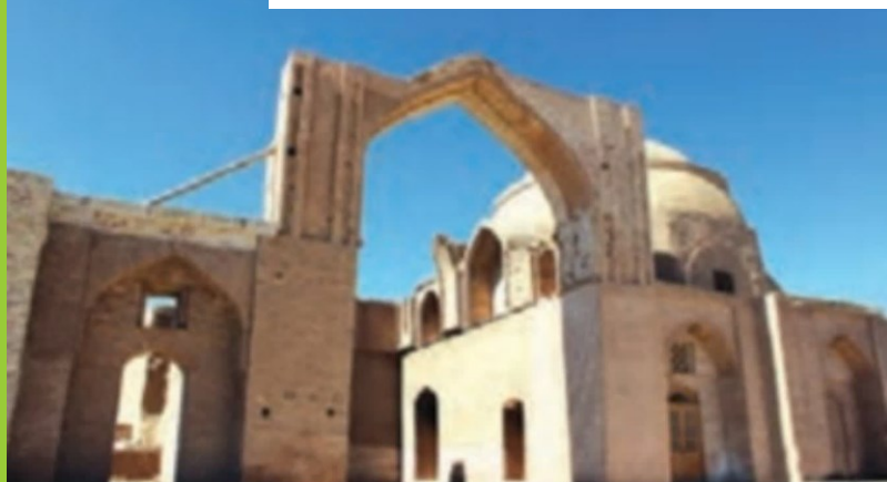
▲ مسجد جامع رُشتخوار، استان خراسان رضوی، به جا مانده از دوره ی خوارزمشاهیان

حاکمان ترک تبار که از اقوام بیابان گرد بودند، از کشورداری اطلاع چندانی نداشتند. آنها می دانستند که برای اداره ی سرزمین پهناور ایران و جمعیت زیاد آن، باید از افرادی آشنا با کشورداری استفاده کنند. به همین دلیل، وزیران باهوش و خردمند ایرانی را انتخاب می کردند. یکی از وزیران مشهور سلجوقیان، خواجه نظام الملک توسی بود. وی خدمات زیادی در راه عمران و آبادانی ایران انجام داد.