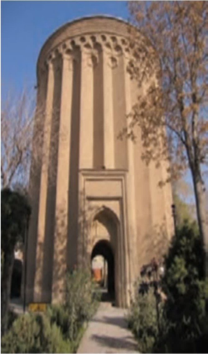
۸ برج طغرل در شهر ری