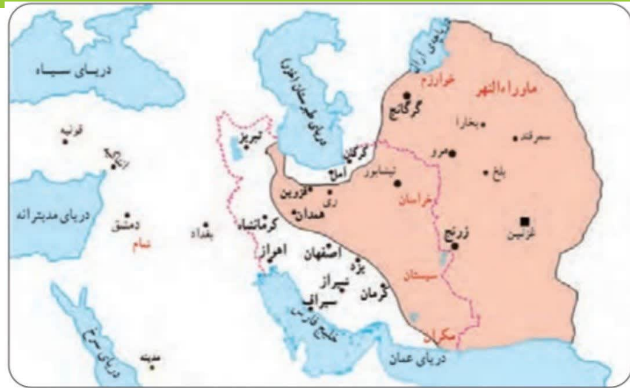
قلمرو غزنویان مرزهای ایران کنونی بایتخت