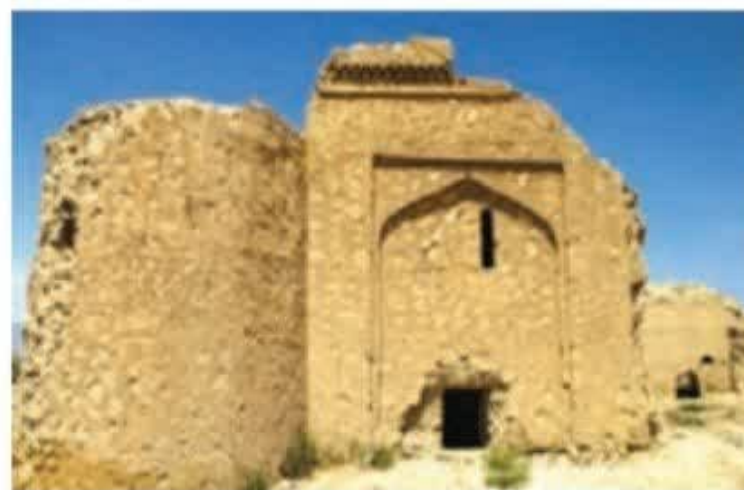
▲ بقایای کاروان‌سرای رباط قره عشق، خراسان شمالی