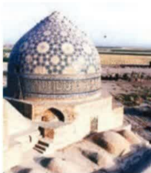
▲ مسجد جامع ساره

• در این دوره، همچنین مساجد، برج‌ها، مناره‌ها و کاروان‌سراهای باشکوهی بنا شدند.