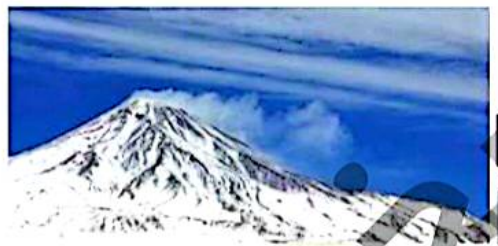
ارتفاع قله‌ی دماوند

به زمین‌های پایین کوه کوهپایه می‌گویند. در بیش‌تر کوهپایه‌ها، شهرها و روستاهایی به‌وجود آمده‌اند، زیرا این ناحیه از نظر آب و هوایی و کشاورزی و سکونت بسیار مناسب است.