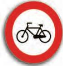
عبور دوچرخه سوار ممنوع