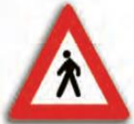
محل عبور عابر پیاده