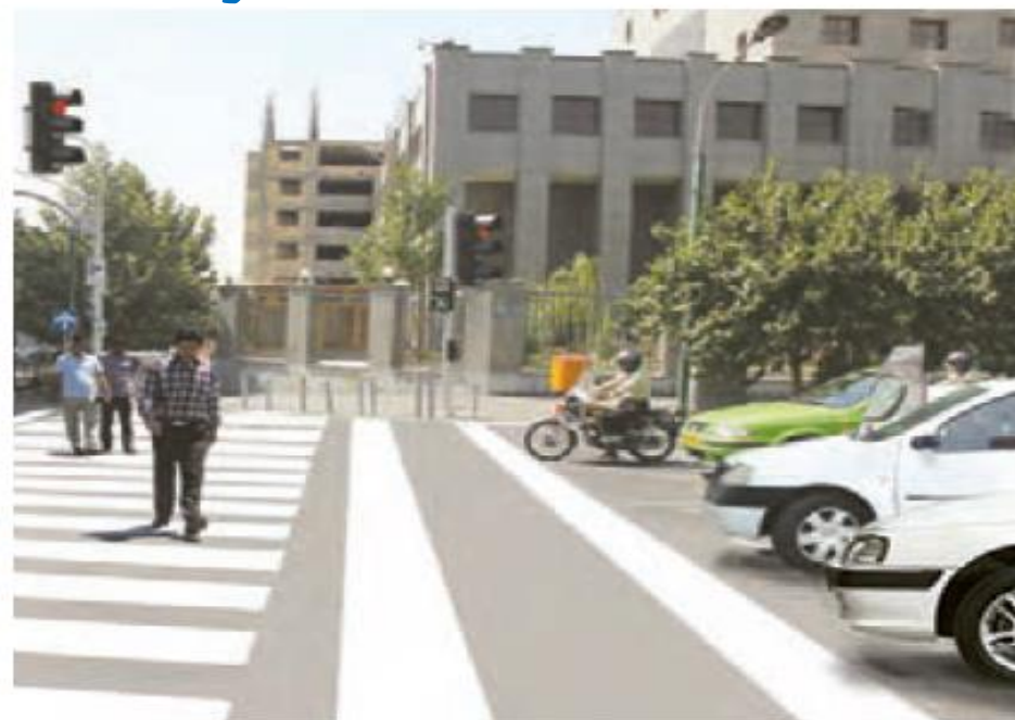
توقف وسایل نقلیه پشت چراغ راهنمایی