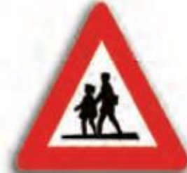
محل عبور دانش آموزان