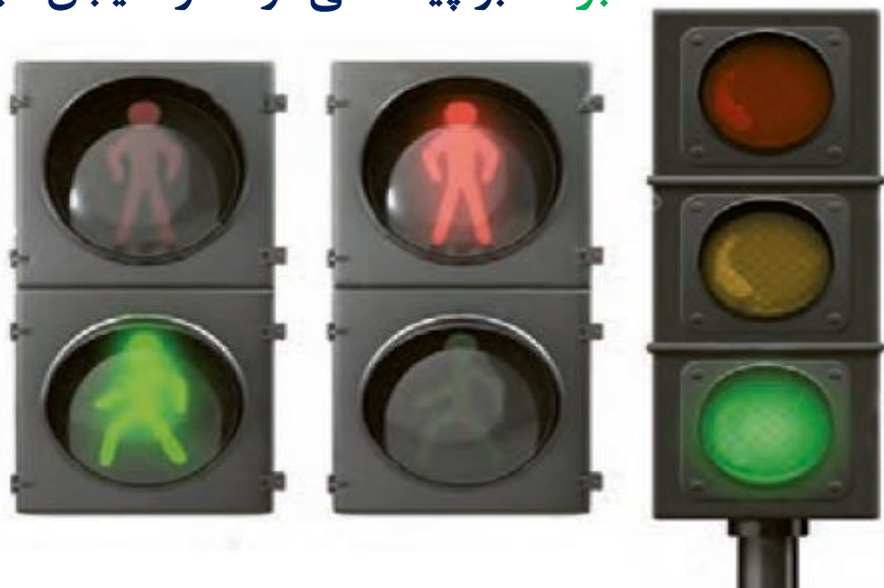
چراغ راهنمایی مخصوص وسایل نقلیه و عابر پیاده

چراغ عابرین پیاده چند رنگ دارد؟ هر رنگ به چه معناست؟ قرمز: عابر پیاده نمی‌تواند از خیابان عبور کند. سبز: عابر پیاده می‌تواند از خیابان عبور کند. ۲ رنگ