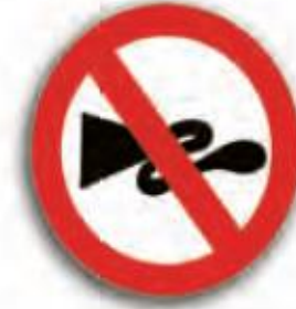
بوق زدن ممنوع