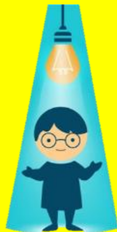
آفرین درسته بچه ها