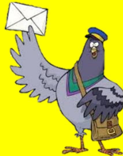
کبوتران نامه بر