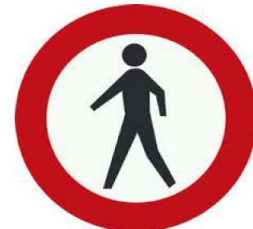
عبور عابر پیاده ممنوع