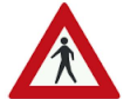
محل عبور عابر پیاده