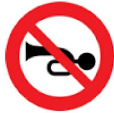
بوق زدن ممنوع