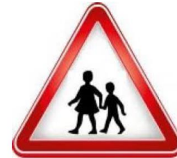
محل عبور دانش آموزان