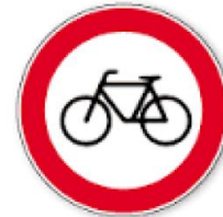
عبور دوچرخه سوار ممنوع