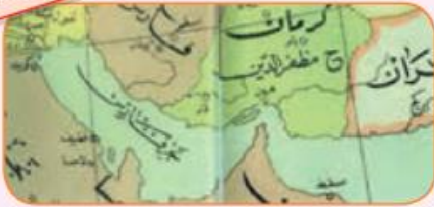
نقشه‌ی خلیج فارس در قرن هشتم هجری

خلیج فارس یکی از مهم‌ترین مناطق کره‌ی زمین است. از گذشته‌های بسیار دور مردمان این منطقه به تجارت و دریانوردی مشغول بوده‌اند. قوم پارس این دریا را دریای پارس نامیدند. در کتیبه‌ای که از داریوش، پادشاه هخامنشی به دست آمده از این محل به نام دریای پارس یاد شده است. بعدها بسیاری از دانشمندان و جغرافی‌دانان مسلمان چون ابوریحان بیرونی نیز در کتاب‌هایشان نام خلیج فارس و دریای پارس را آورده‌اند. روی نقشه‌های اروپاییان هم که از عصر اکتشافات جغرافیایی به جا مانده است، نام خلیج فارس مشاهده می‌شود.