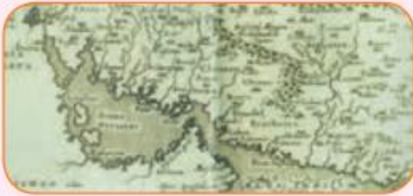
نقشه‌ی خلیج فارس در دوره‌ی صفویه