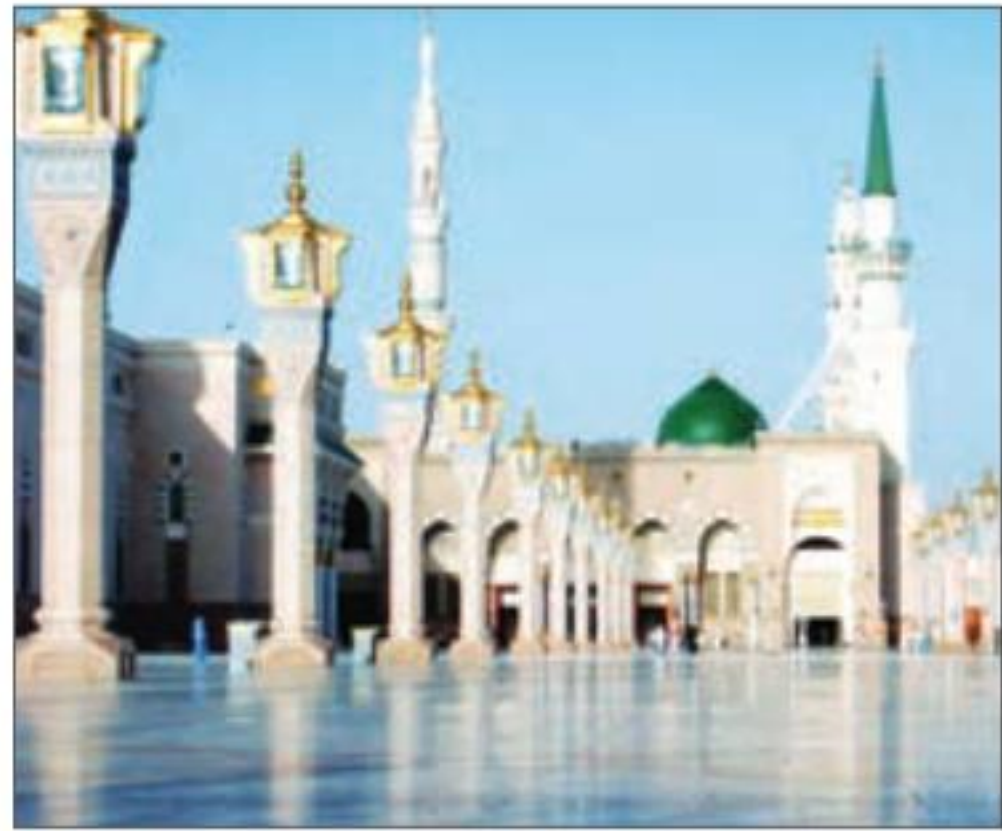
مدینه‌ی منوره، مرقد مطهر پیامبر اکرم (ص)