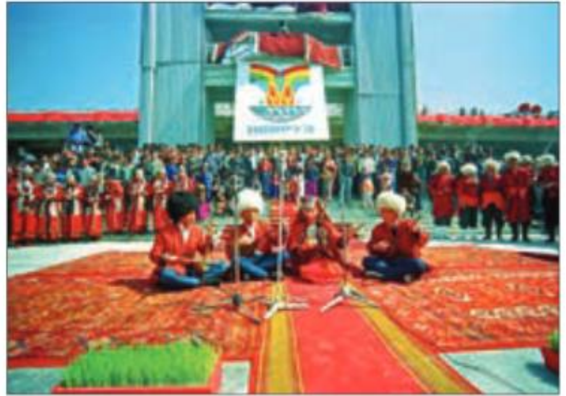
برگزاری جشن نوروز در یکی از کشورهای همسایه