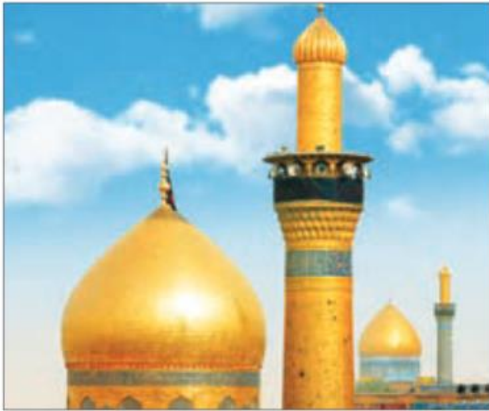
حرم مطهر حضرت امام حسین (ع) و حضرت ابوالفضل (ع) در کربلا