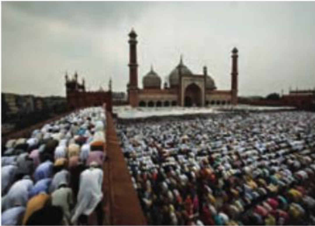
برگزاری مراسم عید فطر در یکی از کشورهای همسایه