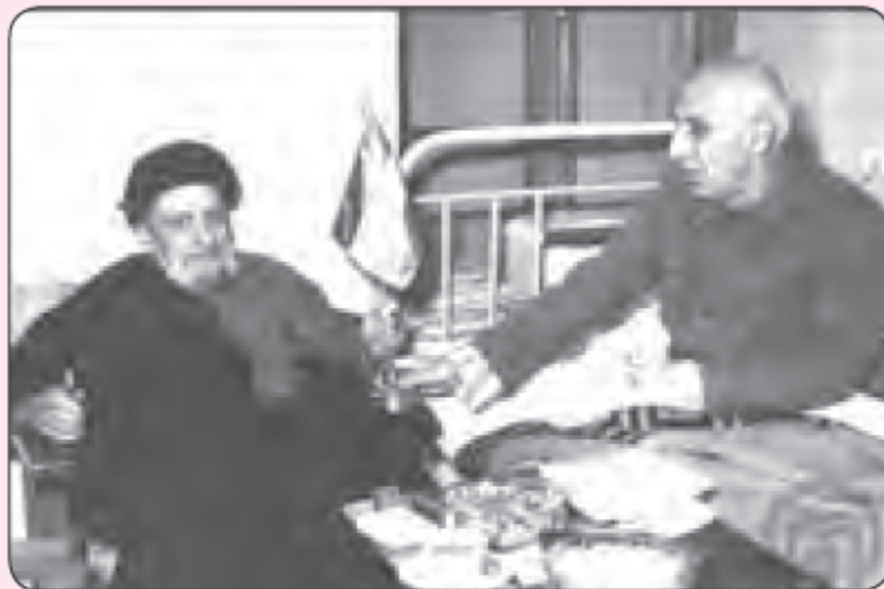
دکتر مصدق و آیت‌الله کاشانی

○ دکتر محمد مصدق و آیت‌الله سید ابوالقاسم کاشانی از آغاز کشف و استخراج نفت در ایران، دولت انگلستان که از محصول نفت ایران درآمد زیادی کسب می‌کرد با بستن قراردادهایی منابع نفتی ما را غارت می‌کرد. دکتر محمد مصدق که در زمان حکومت پهلوی نماینده‌ی مجلس بود، شجاعانه در مقابل استعمار انگلیس ایستاد و برای ملی کردن نفت به مبارزه برخاست. در همان زمان آیت‌الله کاشانی نیز که از علمای مبارز و مخالف شدید استعمارگران بود از نهضت ملی شدن نفت ایران حمایت کرد و در این کار نقش بسیار مهمی داشت. سرانجام در اسفندماه سال ۱۳۲۹ شمسی مجلس شورای ملی قانون ملی شدن نفت را تصویب کرد تا دست بیگانگان را از نفت ایران کوتاه کند.