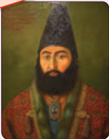
تندیس امیر کبیر

○ امیر کبیر، میرزا تقی خان فراهانی مشهور به امیر کبیر در روستایی در اراک به دنیا آمد. او صدراعظم یا نخست‌وزیر ناصرالدین شاه بود. امیر کبیر وقتی به این مقام رسید، آرزو داشت ایران را به کشوری مستقل و آباد تبدیل کند. در زمان او دولت‌های روس و انگلیس به شدت در امور کشور دخالت می‌کردند. امیر کبیر از دخالت شاهزادگان و درباریان در کشور جلوگیری نمود. او مدرسه‌ای تأسیس کرد تا افراد با علوم و فنون جدید آشنا شوند؛ روزنامه منتشر کرد و چندین کارخانه نیز تأسیس کرد. او از دخالت نمایندگان خارجی در امور داخلی ایران جلوگیری می‌کرد و می‌گفت: «نه به انگلیس امتیاز می‌دهیم و نه به روسیه». بیگانگان که فهمیده بودند با مردی روبه‌رو شده‌اند که نمی‌گذارد به اهدافشان برسند با بعضی از درباریان همدست شدند و آن قدر علیه او نزد شاه بدگویی کردند که شاه او را از صدراعظمی برکنار کرد و سپس با دستور ناجوانمردانه‌ی شاه، او را در فین کاشان به شهادت رساندند.