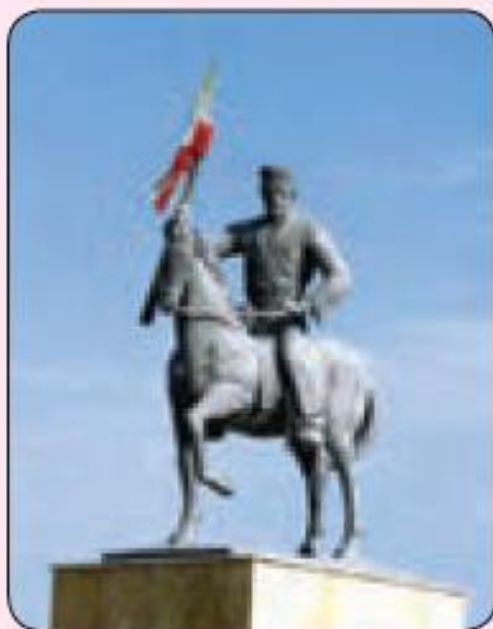
مجسمه‌ی رئیس علی دلواری در بوشهر

○ رئیس علی دلواری : رئیس علی دلواری در اطراف شهر بوشهر چشم به جهان گشود. رئیس علی مردی شجاع بود و ایمانی قوی داشت. او در تیراندازی و سوارکاری ماهر بود. با شروع جنگ جهانی اول، انگلیسی‌ها جنوب ایران به ویژه بوشهر را اشغال کرده، و پرچم خودشان را در آنجا افراشته بودند. او در باره‌ی اشغال نظامی ایران به چند تن از روحانیون بوشهر نامه نوشت و آنها نیز در جواب گفتند که جنگیدن با اشغالگران واجب است. رئیس علی و هوادارانش که به آنها دلیران تنگستان می گفتند، قهرمانانه با انگلیسی‌ها جنگیدند. اما در یکی از این نبردها، رئیس علی تیر خورد و به شهادت رسید.