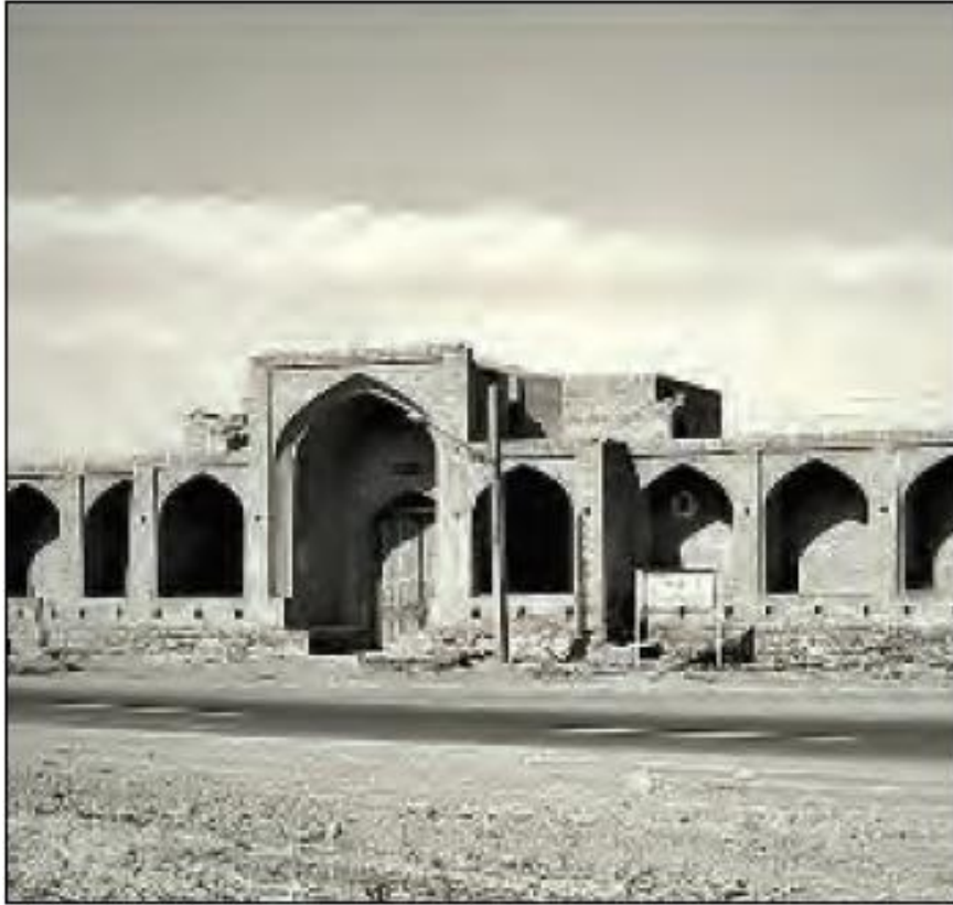
کاروانسرای شاه عباسی، سمنان