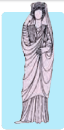
طرحی از پیراهن‌های زنان در دوره‌ی اشکانی