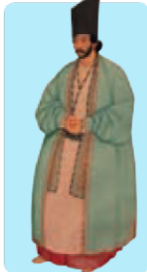
تصویر مردی با کلاه نادری