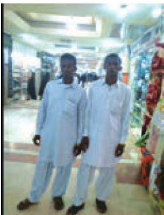
▲ لباس مرد بلوچ

اگر روزی سری به یک «موزه‌ی مردم‌شناسی» بزنید در آنجا می‌توانید انواع لباس‌های محلی را مشاهده کنید.