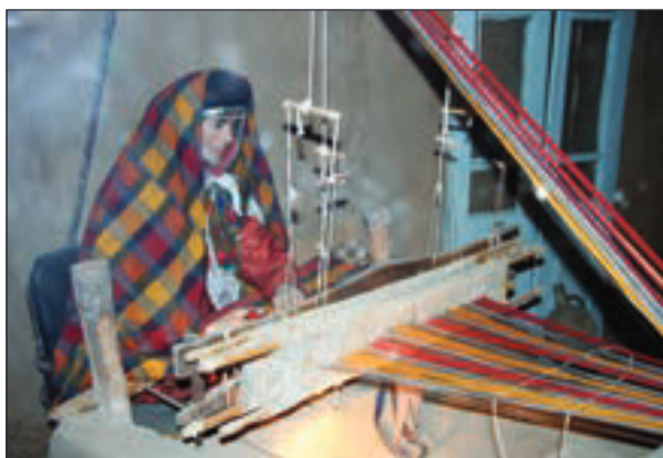
▲ مجسمه‌ی لباس محلی در موزه‌ی مردم‌شناسی