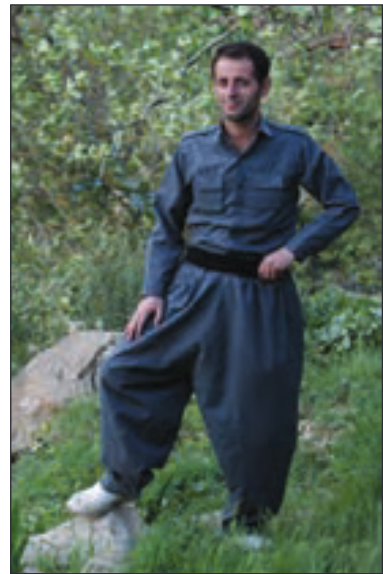
▲ لباس مرد گُرد