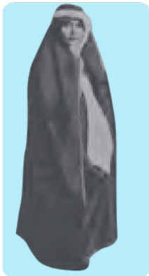
لباس زنان در دوره‌ی قاجار