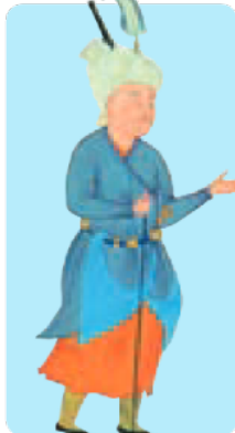
لباس مردان در دوره‌ی صفویه