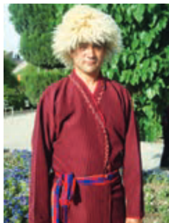
▲ لباس محلی مردم ترکمن