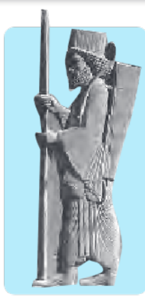
لباس مردان در دوره‌ی هخامنشی