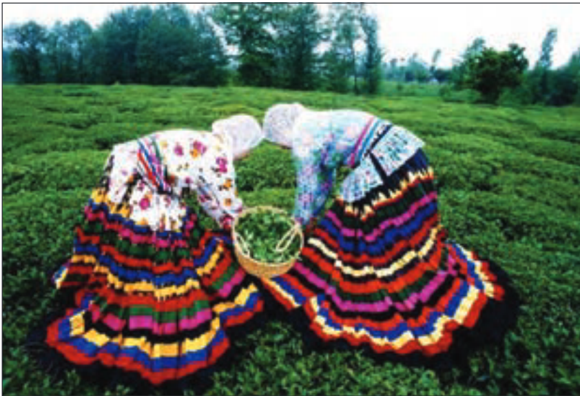
▲ در کرانه‌ی دریای خزر، زنان قاسم‌آبادی، دامن‌های بلند می‌پوشند که تا روی کفش می‌افتد و با نوارهای رنگی تزیین شده است. پهنای دامن گاه بیش از ده متر است.