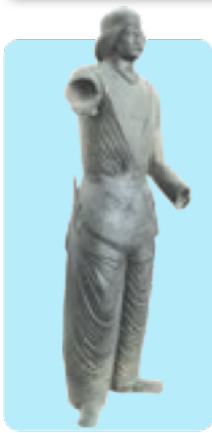
مجسمه‌ی مرد اشکانی با کلاه و شلوار گشاد تاروی پا

به نظر شما چرا لباس‌های محلی را در موزه‌ی مردم‌شناسی حفظ و نگهداری می‌کنند؟