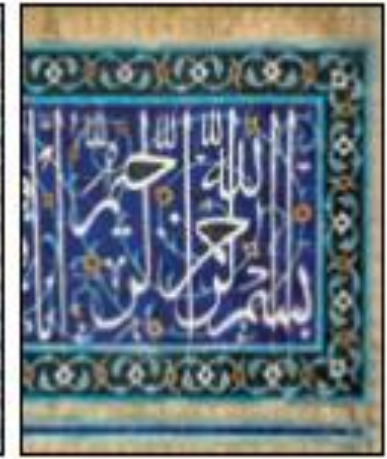
نمونه‌هایی از کتیبه، خط و کاشی کاری