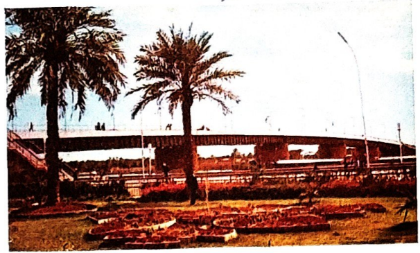
عکس خرمشهر قبل از حمله‌ی نظامی