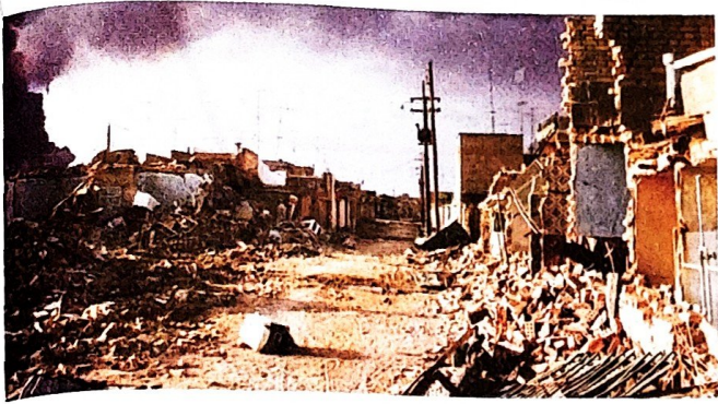
عکس خرمشهر بعد از حمله‌ی نظامی