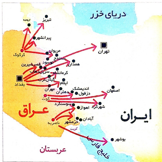
مسیر حمله ی هوایی ارتش عراق