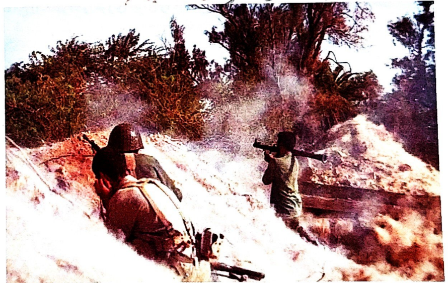
صحنه‌هایی از دفاع رزمندگان

۸- در روزهای آغازین جنگ مقاومت مردم در خرمشهر چگونه بود؟