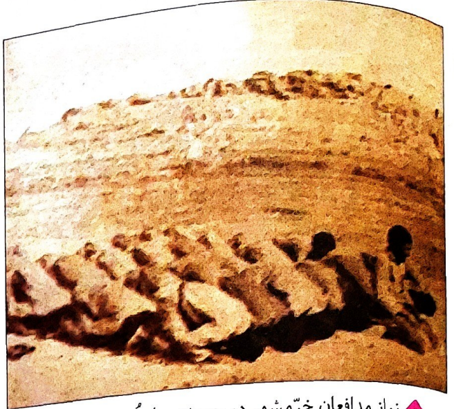
نماز مدافعان خرمشهر در حومه‌ی دارخوین