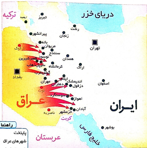
مسیر حمله ی زمینی ارتش عراق

در روز ۳۱ شهریور ۱۳۵۹ در حالی که مردم به زندگی خود مشغول بودند و دانش آموزان و خانواده هایشان برای شروع سال تحصیلی آماده می شدند، ناگهان صداهای مهیبی همه را وحشت زده کرد. هواپیماهای عراقی در آسمان خرمشهر و تعدادی دیگر از شهرهای ایران ظاهر شدند و بمب های خود را بر سر مردم فروریختند. به نقشه های زیر توجه کنید. همان طور که می بینید، پس از حمله ی هواپیماهای عراقی به بعضی از شهرهای کشور، هجوم زمینی ارتش این کشور نیز به سرزمین جمهوری اسلامی آغاز شد. این حملات سر آغاز جنگ تحمیلی و هشت سال دفاع مقدس مردم ایران در مقابل دشمنان بود.