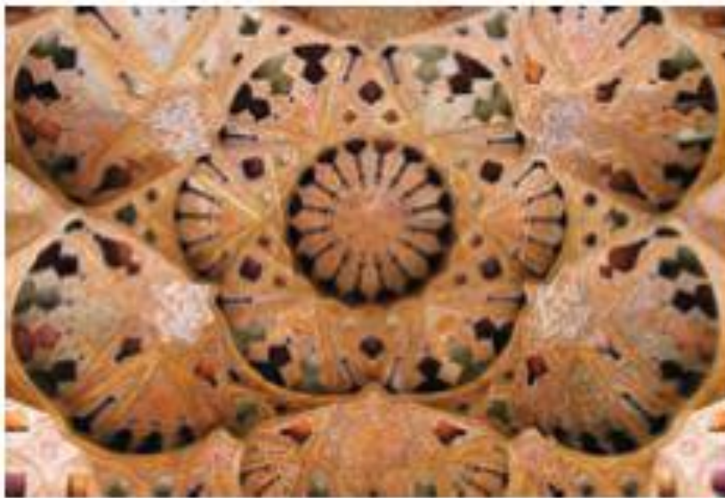
مینیاتور داخل کاخ عالی قاپو