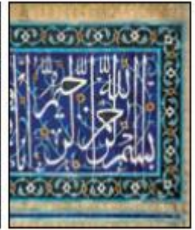
نمونه‌هایی از کتیبه، خط و کاشی کاری