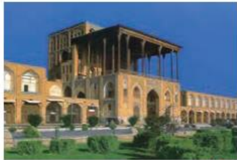
تصویر کاخ عالی قاپو