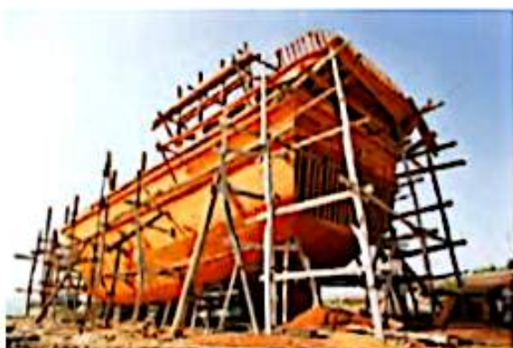
کارگاه کشتی‌سازی در جنوب

با توجه به تنوع فعالیت‌ها در دریا، انواع کشتی‌های ماهیگیری، تفریحی، تجاری و نفتکش در کارخانه‌های کشتی‌سازی تولید می‌شود. کارخانه‌های کشتی‌سازی و لنج‌سازی در اطراف بندرعباس، بوشهر و چابهار در جنوب و نکادر سواحل دریای خزر نمونه‌ای از این مراکز هستند. در این نواحی، مراکزی نیز برای تعمیر کشتی‌ها به وجود آمده است. در نتیجه دریا شغل‌های گوناگونی را برای مردم به‌خصوص ساحل‌نشینان فراهم آورده است.