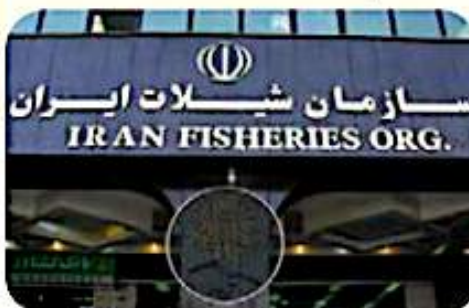
▲ سازمان شیلات جمهوری اسلامی ایران