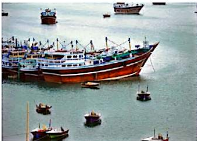
▲ قایقرانی در چابهار