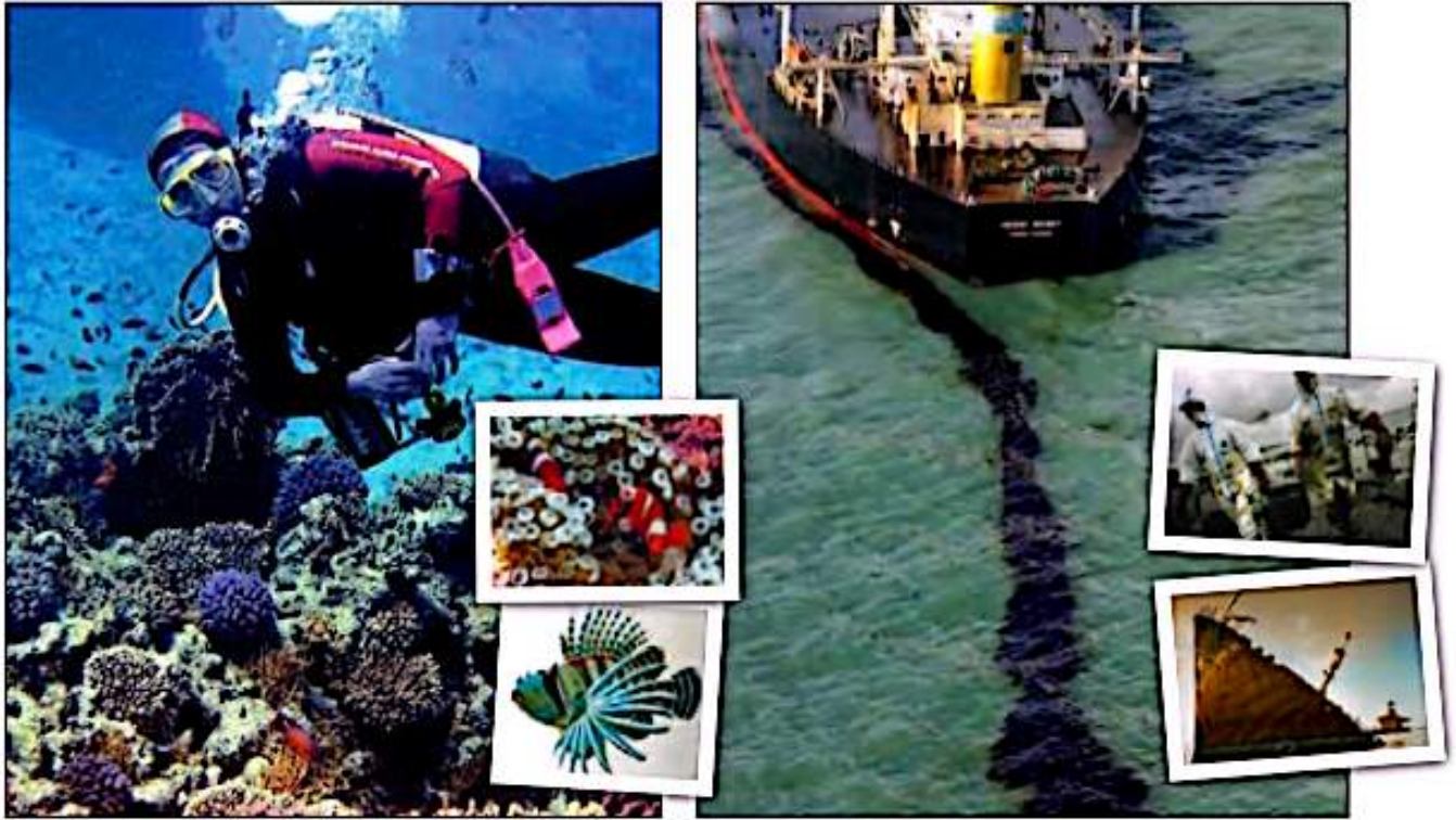
▲ اعماق آبهای خلیج فارس