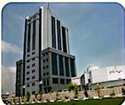
▲ سازمان بنادر و دریانوردی

ب - به این دو تصویر، توجه و پرس‌وجو کنید هر یک از این سازمان‌ها چه وظیفه‌ای دارند و در چه زمینه‌ای فعالیت می‌کنند؟