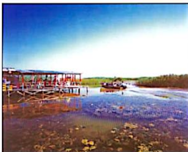
▲ اوقات فراغت در کنار دریای خزر