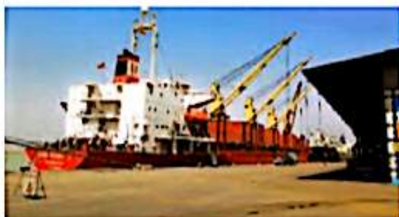
بارگیری کشتی‌ها در بندر خلیج فارس

یک کنسرو ماهی را به کلاس بیاورید و با راهنمایی معلم برچسب مشخصات (تاریخ مصرف، نوع ماهی، طریقه‌ی مصرف، محل تولید و ...) آن را بررسی کنید. چگونه می‌توانیم کنسرو ماهی فاسد شده را تشخیص بدهیم؟