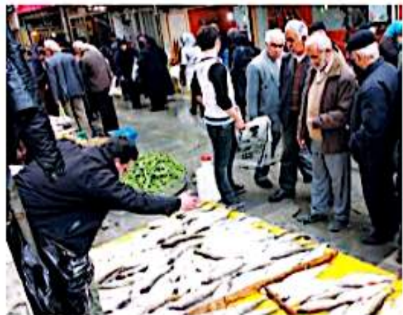
بازار ماهی فروشان در شمال

در این کشتی ها لوازم بيشرفته ی ماهیگیری و سردخانه وجود دارد. به نظر شما چرا کشتی ها و کامیون های حمل ماهی باید بخیچال و سردخانه داشته باشند؟