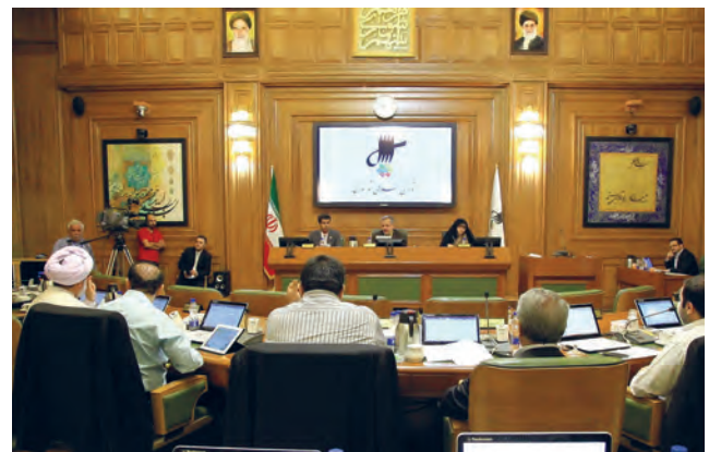
شورای اسلامی شهر تهران