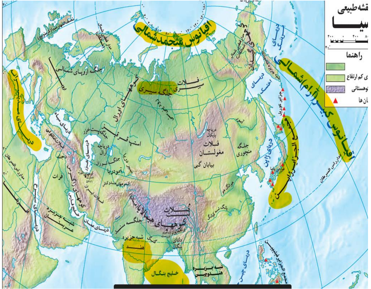
قسمتهای زرد رنگ خوانده شود