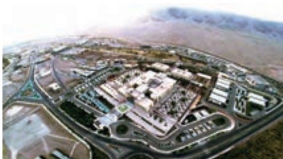
○ کشور های منطقه جنوب غرب آسیا چگونه توانستند اقتصاد خودشان را بهبود بخشند و تحقیقاتی اصفهان