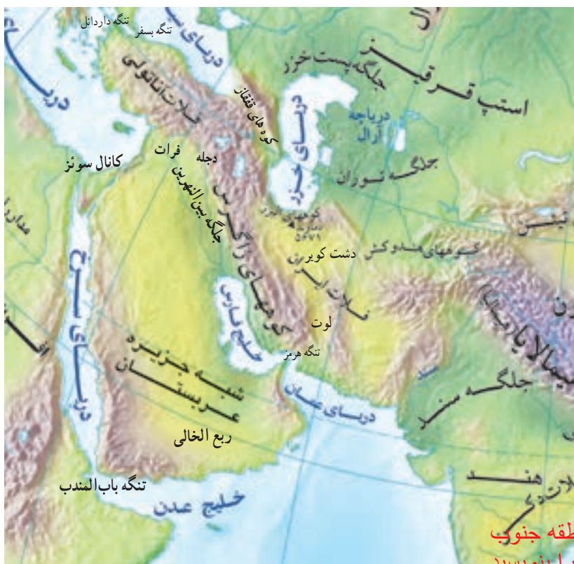
نواحی پست و جلگه ای منطقه جنوب غرب آسیا را بنویسید

در جنوب غربی آسیا، سرزمین های بسیار بلند و سرزمین های پست و همواری وجود دارند: