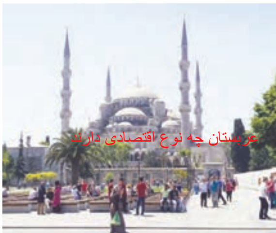
عربستان چه نوع اقتصادی دارند