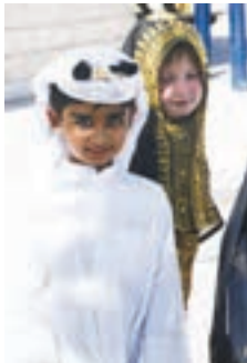
○ چهره کودکان عرب

منطقه جنوب غربی آسیا یکی از نخستین کانون‌های تمدنی جهان است. سال گذشته با بعضی تمدن‌های باستانی که در ایران و بین‌النهرین شکل گرفته و چند هزار سال قدمت دارند، آشنا شدید. جمعیت: در این منطقه، اقوام گوناگونی زندگی می‌کنند. به نمودار جمعیتی کشورهای جنوب غربی آسیا دقت کنید.