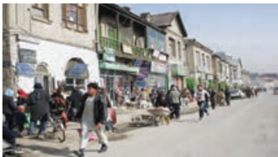
○ کابل، افغانستان

* اغلب کشورهای منطقه جنوب غربی آسیا دارای ذخایر نفت و گاز، این ثروت خدادادی هستند، اما متأسفانه بیشتر آنها از نظر اقتصادی به صادرات نفت وابسته بوده و ماشین آلات، مواد غذایی، دارو و انواع کالاهای مصرفی را از کشورهای دیگر وارد می کنند. کشور عربستان علاوه بر صادرات نفت، همه ساله درآمد زیادی را از طریق مراسم حج و سفر میلیون ها زائر به این کشور نصیب خود می کند.