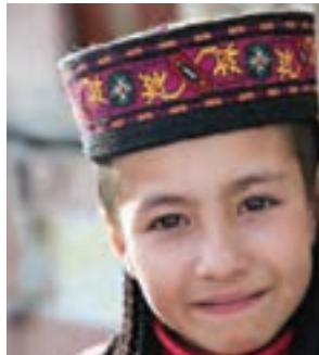
○ چهره کودک تاجیک