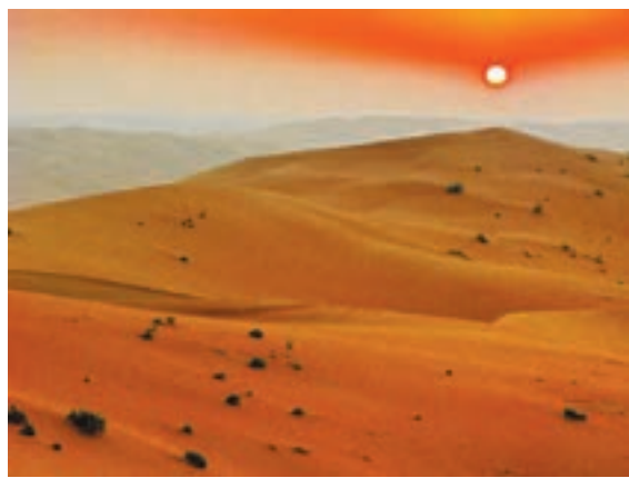
بیابان رابع الخالی، عربستان

نواحی بلند منطقه جنوب غرب آسیا را بنویسید