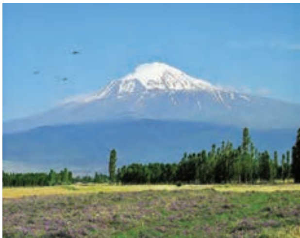
○ کوه آرارات، ترکیه

* در بخش‌های وسیعی از منطقه جنوب غربی آسیا، آب و هوای گرم و خشک یا نیمه خشک حکمفرماست. بیابان‌های وسیع منطقه، آب و هوای گرم و خشک دارند. کمبود آب شیرین یکی از مسائل مهم منطقه جنوب غربی آسیا است که گاهی باعث اختلافات و نزاع‌هایی بین کشورها بر سر منابع آبی رودخانه‌ها شده است.