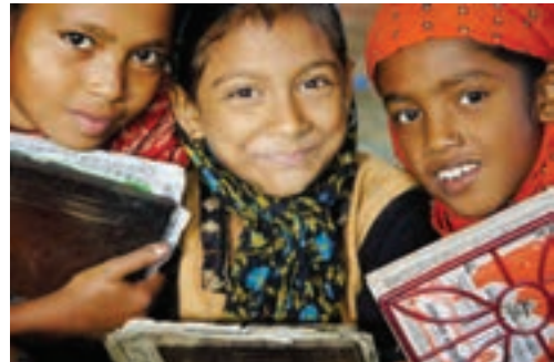
○ چهره کودکان پاکستانی