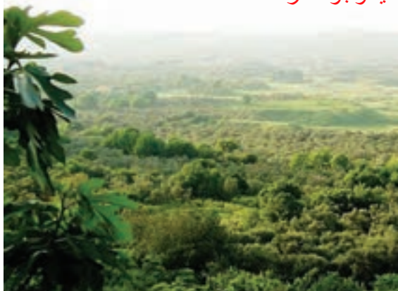
○ باغ‌های زیتون، لبنان

* آن بخش از سرزمین‌هایی که در سواحل دریاهای این منطقه قرار گرفته‌اند، آب و هوای متفاوتی دارند. سرزمین‌های واقع در سواحل گرم خلیج فارس، دریای عمان و اقیانوس هند و دریای سرخ، آب و هوای گرم دارند اما رطوبت هوا به دلیل نزدیکی به دریا زیاد بوده و حالت شرجی به وجود آورده است.