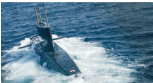
○ زیردریایی ساخت جمهوری اسلامی ایران