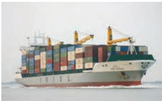
○ حمل بار با کشتی، ایران

ایامی دانیس حمل و نقل دریایی، بسیار ارزان‌تر از حمل و نقل جاده‌ای تمام می‌شود؟ جابه‌جایی بارهای بسیار سنگین و حجیم، فقط با کشتی میسر است. با کامیون‌ها و تریلی‌ها در حمل و نقل جاده‌ای حداکثر می‌توان باری به وزن صد تن را جابه‌جا کرد ولی به وسیله کشتی صدها هزار تن بار به راحتی حمل و نقل می‌شود. ضمناً جابه‌جایی بار توسط کشتی، محدودیت‌ها و موانع حمل و نقل جاده‌ای را نیز ندارد چون در دریای می‌توان کیلومترها راه را بدون برخورد به مانع طی کرد.