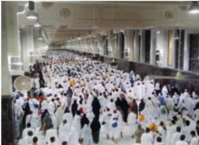
○ مسجد الحرام، سعی صفا و مروه

۳- این منطقه، کانون جهان اسلام است. مکه و مدینه که مقدس‌ترین شهرهای مسلمانان هستند، هر ساله در هنگام مراسم حج، صدها هزار نفر را در خود جای می‌دهند و اجتماع بزرگ و باشکوهی در آنها به وجود می‌آید. اجتماعات بزرگ دیگری مانند راه پیمایی اربعین هر ساله میلیون‌ها انسان را گرد هم جمع می‌کند.