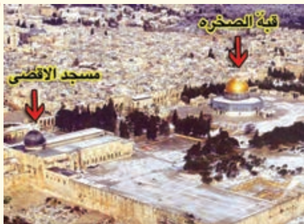
○ مسجد الاقصى و قبة الصخره