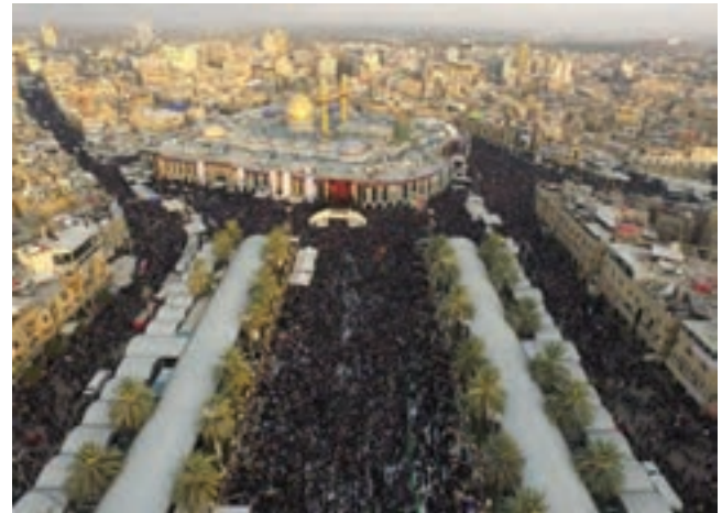
○ کربلا، راه پیمایی عظیم و میلیونی اربعین امام حسین (علیه السلام)

برخی کشورهای منطقه سعی می‌کنند که از طریق پیمان‌های اقتصادی و فرهنگی با یکدیگر، بیشتر همکاری کنند، مانند پیمان سازمان همکاری اقتصادی (اگو) که نخست در سال ۱۳۴۱ بین ایران، پاکستان و ترکیه بسته شد و هم‌اکنون ده کشور منطقه عضو آن هستند.