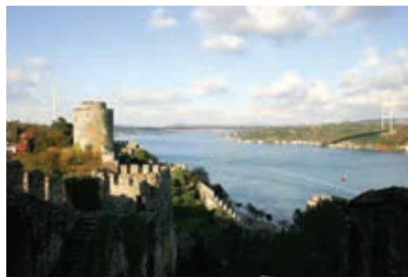
○ تنگه بسفر، ترکیه

از نظر انرژی جنوب غرب آسیا چه اهمیتی دارد