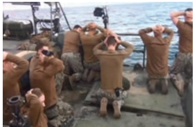
○ بازداشت نظامیان آمریکایی پس از ورود غیرقانونی به مرزهای آبی ایران، خلیج فارس، ۱۳۹۴