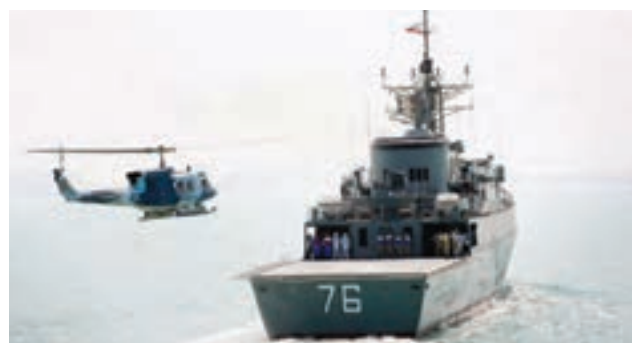
○ ناو جنگی جماران، ساخت جمهوری اسلامی ایران