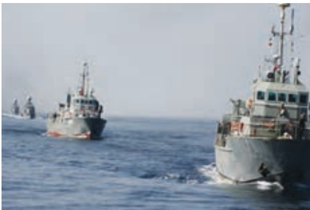
○ حضور نیروهای دریایی جمهوری اسلامی ایران در آب‌های منطقه

* دلاوران نیروی دریایی جمهوری اسلامی ایران همانند نیروهای زمینی و هوایی در جنگ تحمیلی رژیم بعثی عراق علیه ایران، با شجاعت و رشادت فراوان در آب‌ها با دشمنان جنگیدند و از کشور دفاع کردند و نگذاشتند که در رفت‌وآمد کشتی‌های تجاری و واردات کالا به ایران مشکلی پیش بیاید. نیروی دریایی قدرتمند ایران در زمان صلح نیز، حافظ منافع کشور ایران در دریاهاست. نیروی دریایی همچنین در مواقعی که برای کشتی‌ها چه در آب‌های ایران و چه در آب‌های بین‌المللی، حوادثی به وجود بیاید، به آنها کمک می‌رساند.