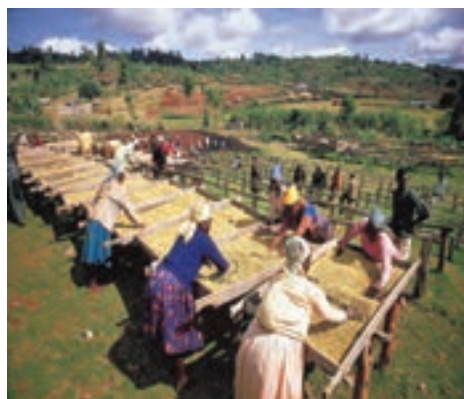
○ کشاورزی کنیا