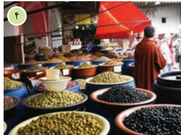
○ کازابلانکا، مراکش