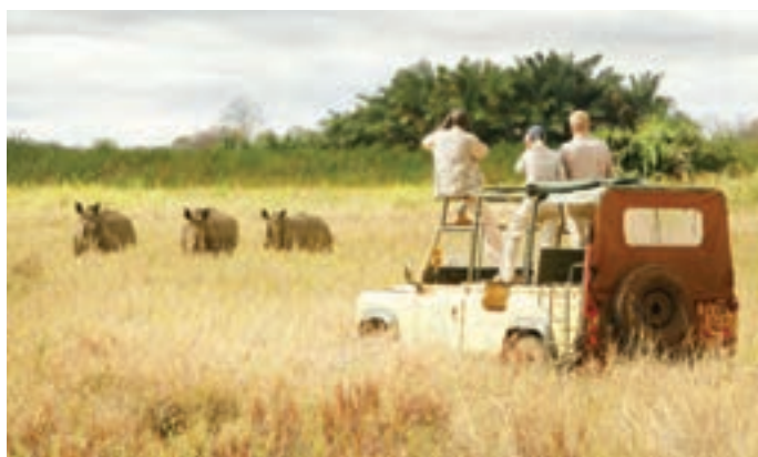
○ گردشگری در پارک های ملی حیات وحش