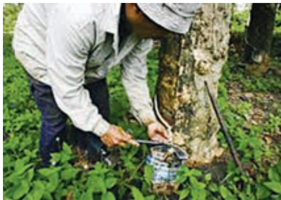
○ استخراج کائوچو