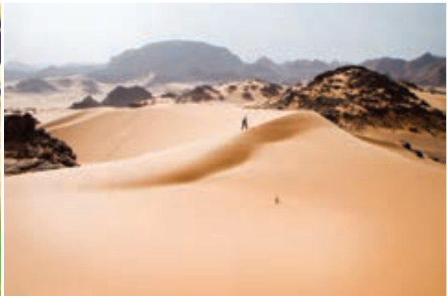
○ افریقای خشک، صحرا (Sahara) ی بزرگ با تپه های ماسه ای عظیم