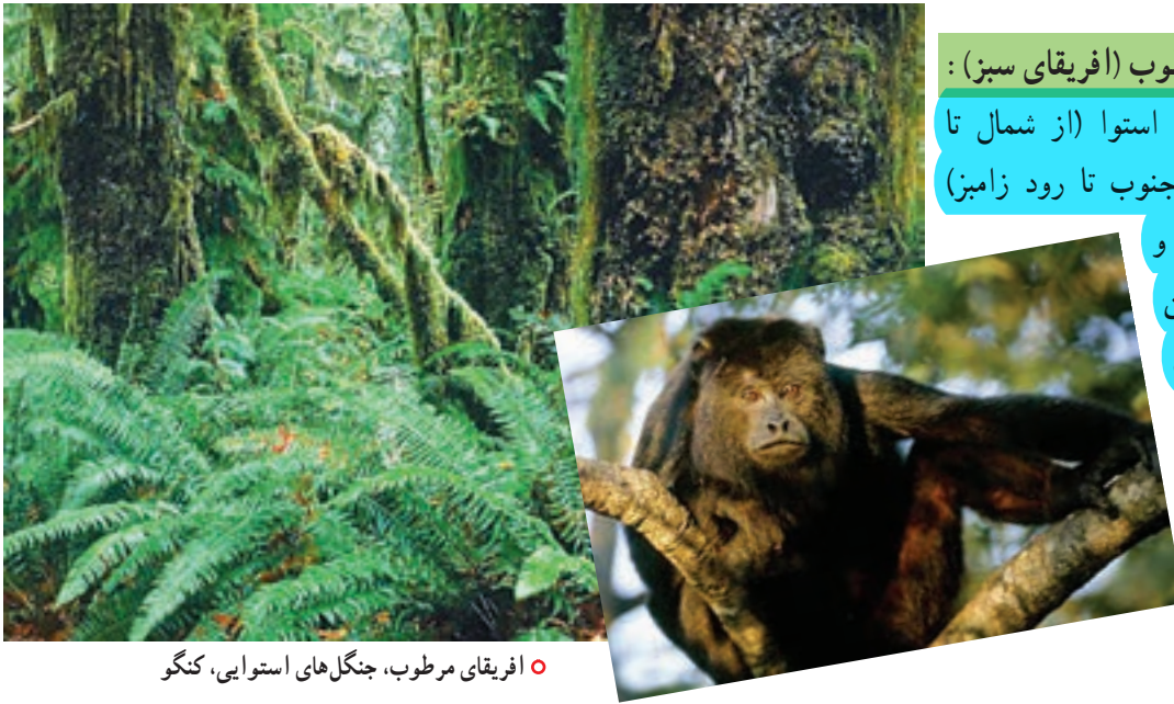
○ افریقای مرطوب، جنگل های استوایی، کنگو

نواحی اطراف خط استوا (از شمال تا دریاچه چاد و از جنوب تا رود زامبزی) آب و هوای گرم و مرطوب دارد. در این منطقه باران فراوان می بارد.