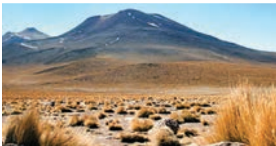
○ بیابان آتاکاما

به نقشه توجه کنید. به طور کلی سه نوع ناهمواری در قاره آمریکا مشاهده می شود. این ناهمواری ها به صورت مشابه، هم در آمریکای شمالی و هم در آمریکای جنوبی وجود دارند.