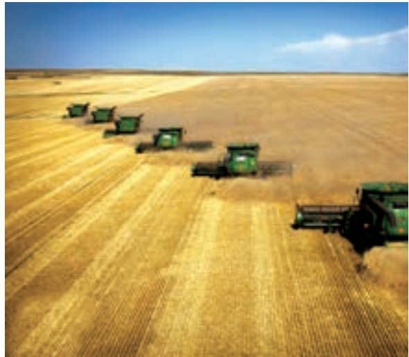
○ برداشت ماشینی (مکانیزه) گندم، ایالات متحده آمریکا