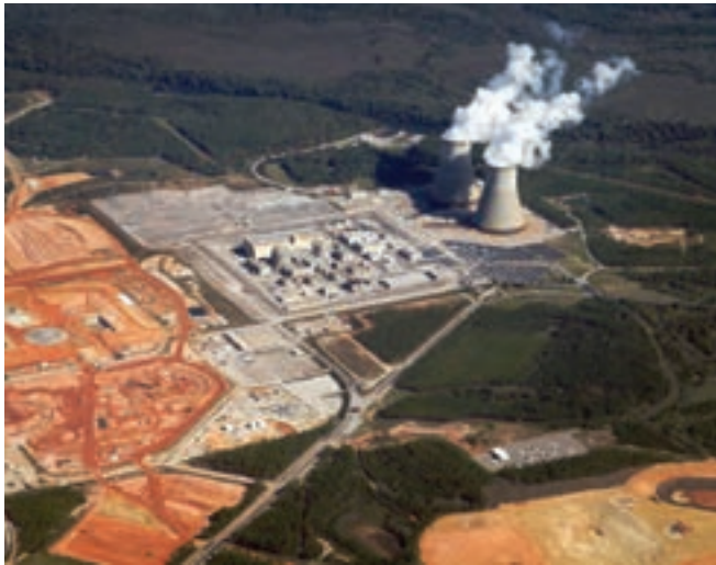
○ یک ناحیه صنعتی، ایالات متحده آمریکا

* کشورهای ایالات متحده آمریکا و کانادا از تولیدکنندگان و صادرکنندگان تجهیزات صنعتی و ماشین‌آلات، خودرو، صنایع غذایی، مواد شیمیایی و کالاهای الکترونیکی هستند.