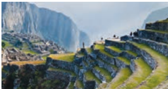
○ کوه های آند

وسعت آمریکا در زمان استقلال، تنها به چند ایالت شرقی محدود بود. از آن به بعد، به روش های مختلف به تدریج ایالت های آمریکا افزایش یافت. به عنوان مثال، تمام یا بخشی از ایالت های تگزاس، نیومکزیکو، یوتا، نوادا، آریزونا، کالیفرنیا و کلرادو متعلق به مکزیک بود که در اواسط قرن ۱۹، آمریکا آنها را با جنگ به قلمروی خود افزود.