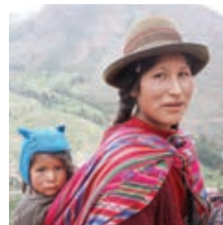
○ چهره یک زن دورگه، آمریکای لاتین