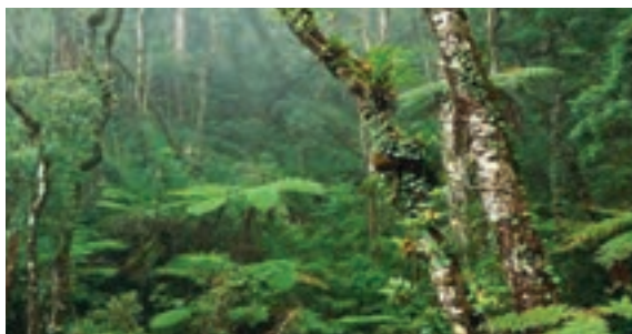
○ جنگل های آمازون

الف) چین خوردگی های جوان و مرتفع: در آمریکای شمالی، رشته کوه های راکی (روشوز) و در آمریکای جنوبی، رشته کوه های آند، چین خوردگی های جوان آمریکا را تشکیل می دهند.