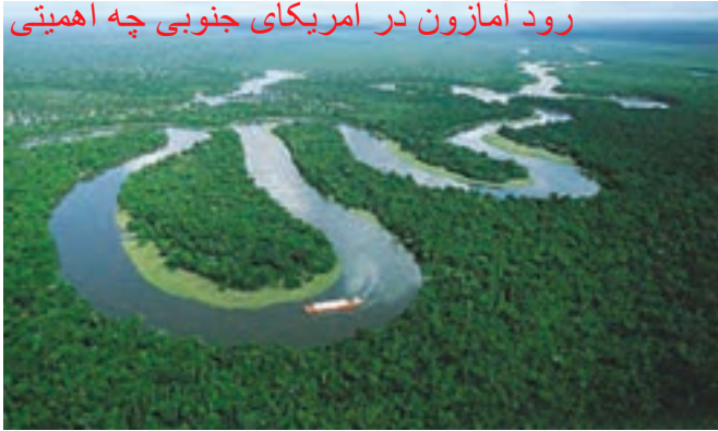
○ رود آمازون، آمریکای جنوبی

رود آمازون در آمریکای جنوبی چه اهمیتی دارد