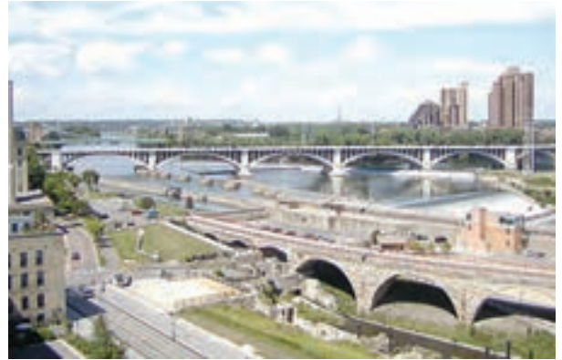
○ رود می سی سی پی، ایالات متحده آمریکا