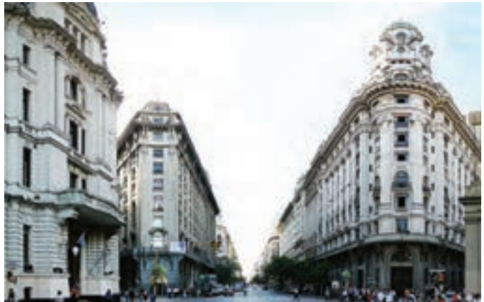
بوئنوس آیرس، آرژانتین