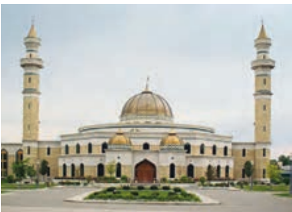
مرکز اسلامی دیترویت، مسجد شیعیان در ایالت میشیگان ایالات متحده آمریکا