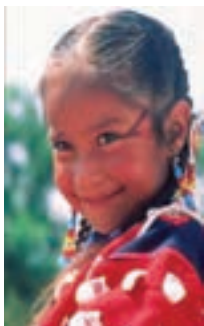
○ چهره یک کودک سرخ پوست