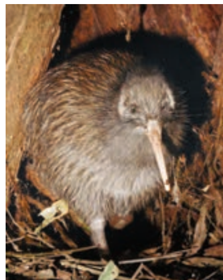
○ کیوی، مرغ نوک‌درازی است که پرواز نمی‌کند. این مرغ، نشانه و نماد کشور نیوزیلند است و تصویر آن را می‌توان روی سکه‌ها و تمبرهای این کشور دید.