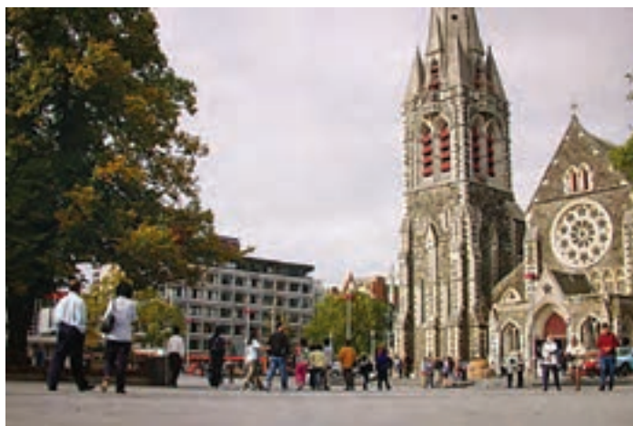
○ کریست چرچ، میدان کلیسا، نیوزیلند