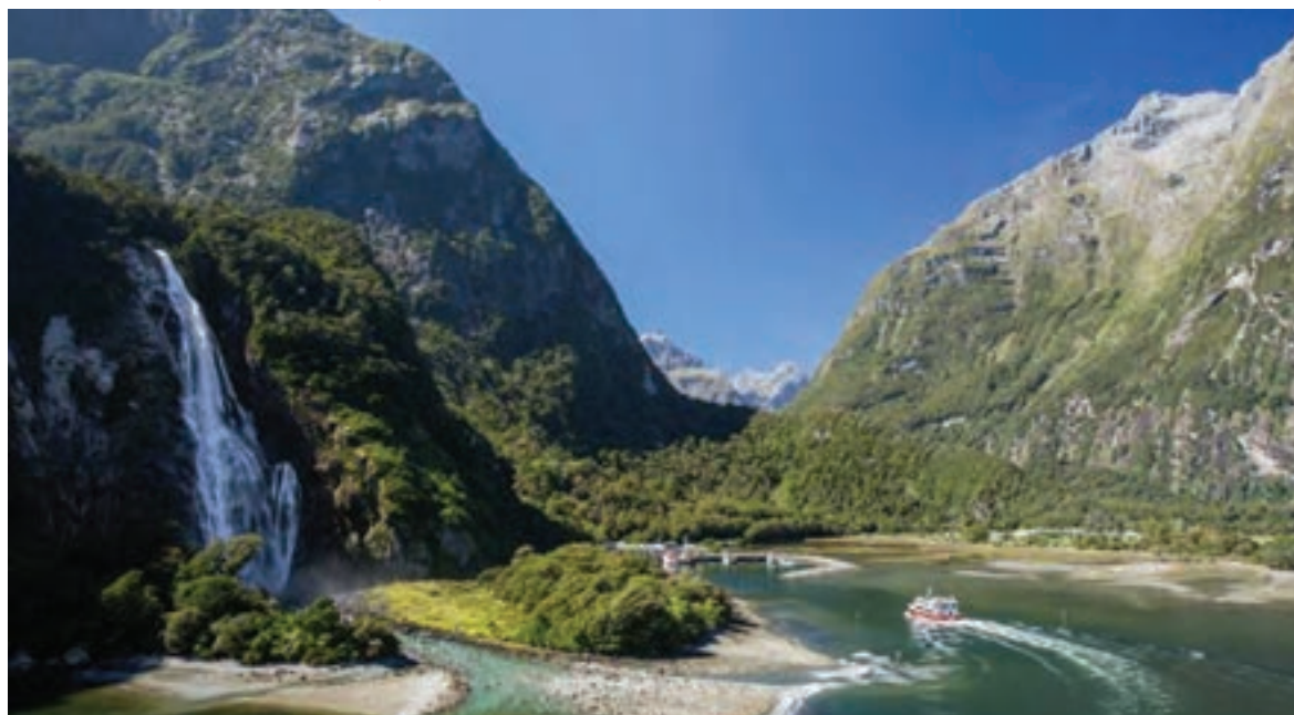
تنگه میلفورد در نیوزیلند