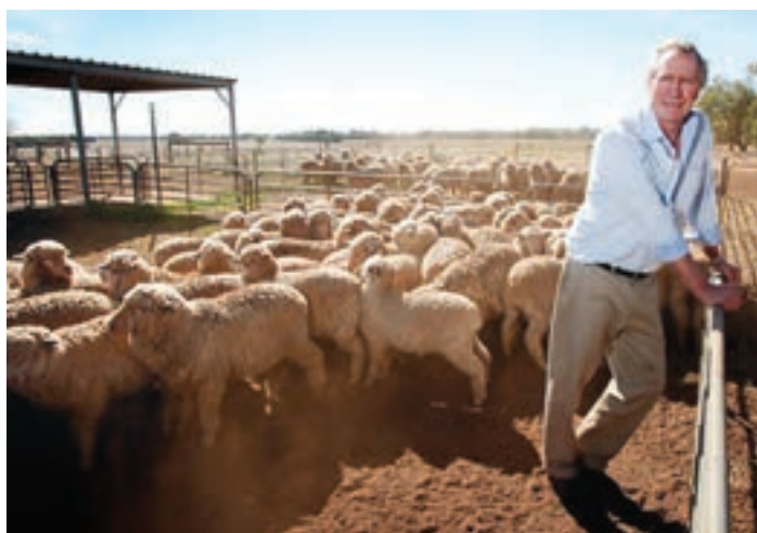
پرورش گوسفند، استرالیا

استرالیا تولیدکننده و صادرکننده بزرگ گندم در جهان است. همچنین باغهای انگور و مرکبات فراوانی دارد و کشاورزی در این کشور به روش صنعتی و با استفاده از ماشینآلات، صورت می گیرد. استرالیا و نیوزیلند هر دو از مراکز مهم پرورش دام در جهان اند و محصولات دامی به ویژه گوشت و پشم، از صادرات مهم این دو کشور است.