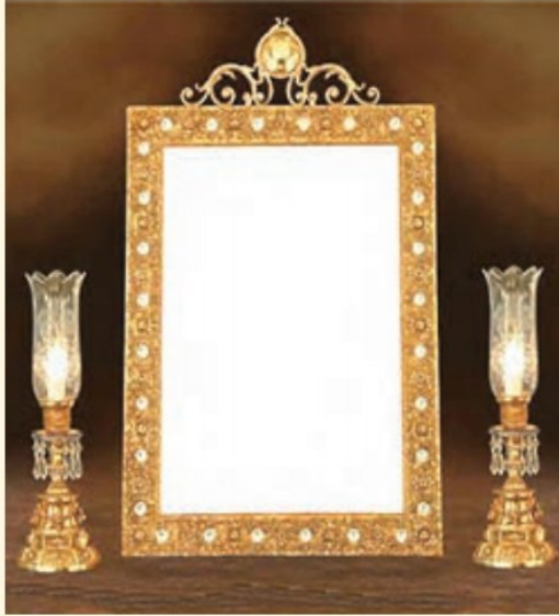
استفاده از آینه و شمعدان در مراسم ازدواج یکی از رسوم به جامانده از ایران باستان است. در آن دوره در مراسم ازدواج از آینه به عنوان نماد راستی و صداقت در زندگی مشترک استفاده می کردند.

به طور کلی، از اوضاع و احوال مردم ایران باستان شواهد و مدارک اندکی به جای مانده است. با این حال مورخان توانسته اند با بررسی همین آثار به جامانده تا حدودی به اوضاع اجتماعی آن دوره پی ببرند.