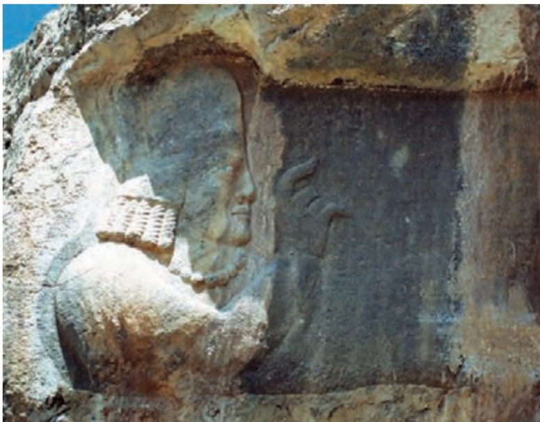
نقش برجسته کرْتیر، موبد معروف دوره ساسانی در نقش رجب (استان فارس)

نفوذ زیادی داشتند. در جامعه طبقاتی، رفتن از طبقه‌ای به طبقه دیگر بسیار سخت و تقریباً ناممکن بود؛ یعنی فرزند کشاورز می‌بایستی تا ابد کشاورز بماند. همچنان که اشراف زادگان همیشه در گروه اشراف می‌ماندند. افراد از طبقه محروم نمی‌توانستند با بزرگان ازدواج کنند. لباس و مسکن طبقات نیز متفاوت بود. در شهرها پیشه‌وران و کشاورزان نمی‌توانستند در محله خاص بزرگان سکونت کنند و به ناچار در حومه* شهرها ساکن می‌شدند. در دوره ساسانی طبقات مختلف حتی آتشکده*های جداگانه‌ای داشتند. این وضع طبقاتی بر روابط، آداب و معاشرت مردم نیز تأثیر گذاشته بود. در چنین شرایطی بود که مردم سخت‌کوش و حق‌طلب ایران، از دین اسلام استقبال کردند و مسلمان شدند، زیرا در این دین انسان‌ها در برابر خدا با هم برابرند و تنها کسانی که درستکار هستند و تقوای بیشتری دارند، نزد خدا گرامی‌تر هستند.