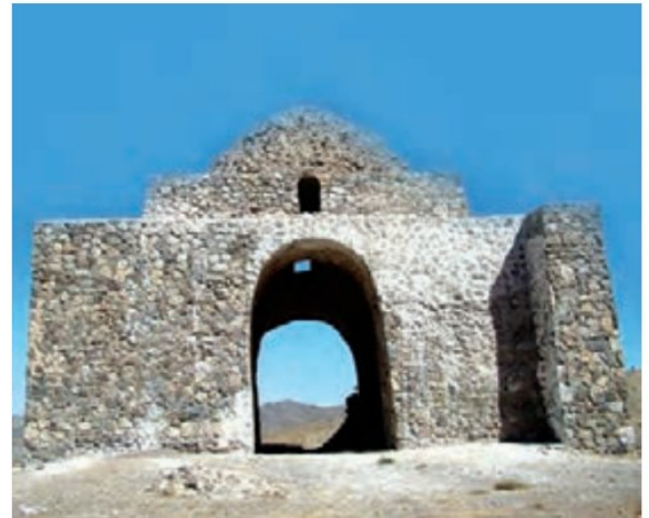
بقایای آتشکده بازه هور، راه مشهد به تربت حیدریه، از آتشکده‌های دوره ساسانیان.

هرودوت تاریخ‌نویس یونانی نوشته است: ایرانی‌ها وقتی در کوچی به هم می‌رسیدند ربوبوسی می‌کردند و اگر با