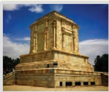
آرامگاه فردوسی، خراسان رضوی

بدو گفت کفشگر کیای خوب چهر نرنجی بگویی به بوذرجمهر که در آن زمانه مرا کودکی است که بازار او بر دلم خوار نیست بگویی مگر شهریار جهان مرا شاد گرداند آندر نهان یکی پور دارم رشید به جای به فرهنگ جوید همی رهنمای فرستاده گفت این ندارم برنج که کوتاه کردی مرا راه گنج اگر شاه باشد بدین دست‌گیر که این پاک فرزند گردد دبیر به یزدان بخواهد همی جان شاه که جاوید بادا سزاوار گاه اما وقتی پیغام به شاه رسید پاسخ داد: