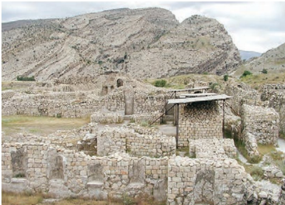
بقایای شهر بیشاپور در نزدیکی کازرون، استان فارس

در این شهرها علاوه بر مأموران حکومتی، صنعتگران، بازرگانان و پیشه‌وران نیز زندگی می‌کردند.