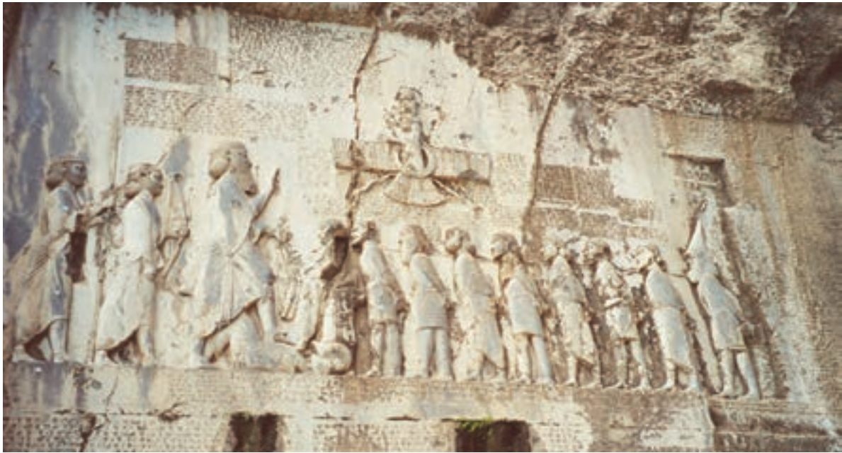
سنگ نگاره و کتیبه داریوش هخامنشی در بیستون: داریوش در کتیبه بیستون از ۲۳ ایالت تحت فرمان خود نام برده است، مانند پارس، خوزیا (خوزستان)، بابل، مصر، اریابه (عربستان)، ارمنیا (ارمنستان) و... این سنگ نگاره در نزدیکی شهر کرمانشاه قرار دارد.