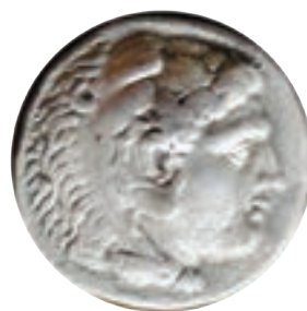
سکه با نقش اسکندر مقدونی