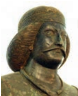
مجسمه مرد پارتی (اشکانی)

همان‌طور که پیش‌تر خواندید، پارت‌ها نیز یکی از اقوام آریایی بودند. رئیس یکی از قبایل پارت ملقب به «اشک» یا «اژشک» با هدف مقابله با سلوکیان، پارتیان و دیگر اقوام ایرانی را متحد کرد. او با استفاده از اختلافات سلوکیان توانست قسمت‌هایی از ایران را آزاد کند. مورخان وی را مؤسس سلسله اشکانی می‌دانند.