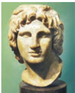
سردیس اسکندر مقدونی