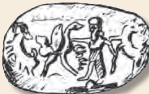
چند نمونه مهرهای مخصوص صاحب منصبان دوره هخامنشی