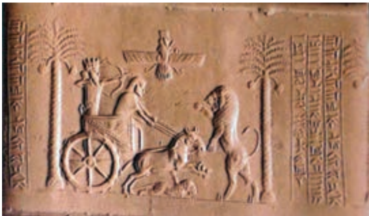
مهر سلطنت داریوش هخامنشی، طول مهر ۳/۵ سانتی متر است. در موزه بریتانیا در لندن نگهداری می‌شود. اسم داریوش روی مهر به سه خط ایلامی، پارسی و بابلی نوشته شده است.

شاهان بر امور اداری، نظامی و مذهبی فرمانروایی مطلق