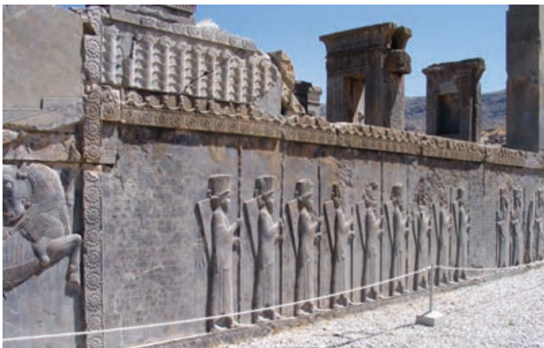
نقش برجسته سربازان سپاه جاویدان در تخت جمشید، استان فارس