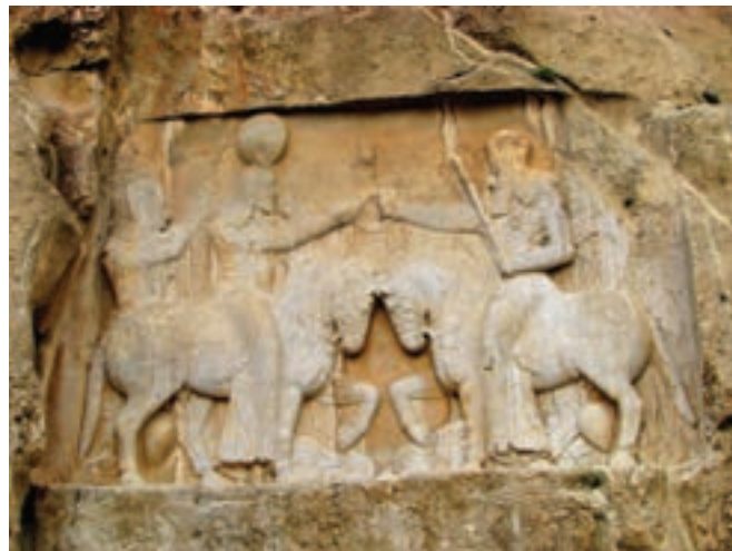
نقش برجسته بخشیدن حلقه شاهی از سوی اهورا مزدا به اردشیر ساسانی (نقش رستم)

شاهان ایران باستان خود را برگزیده آسمان و نماینده اهورا مزدا* می دانستند و معتقد بودند که به حکم او فرمان می رانند. در برخی کتیبه های به جای مانده، جمله هایی که این موضوع را نشان بدهد، وجود دارد.