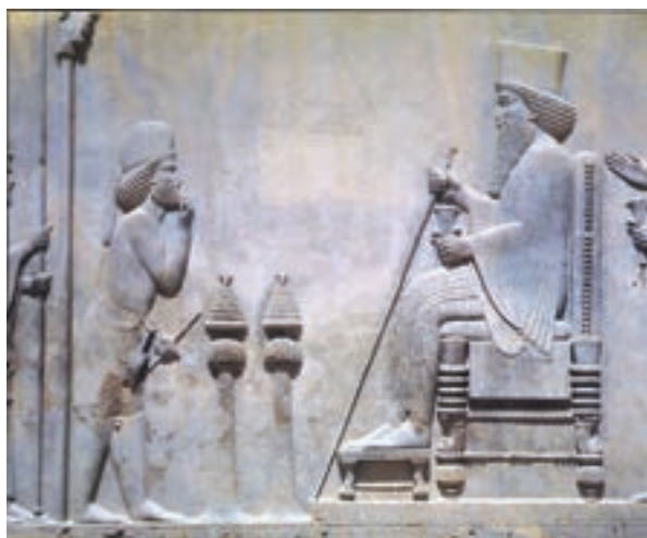
نقش برجسته داریوش در تخت جمشید

در ایران باستان شیوه حکومت پادشاهی بود. شاهان در ابتدای سلطنت در حضور بزرگان کشور، تاج گذاری می کردند و در کاخ بر تخت می نشستند. شاه قدرت مطلق داشت و همه باید از او فرمان می بردند. حکومت موروثی بود و معمولاً از پدر به پسر به ارث می رسید. البته گاهی بر سر جانشینی شاه و به دست آوردن قدرت، اختلافات شدیدی پیش می آمد و حتی منجر به کشته شدن افراد زیادی و جنگ و خون ریزی می شد.