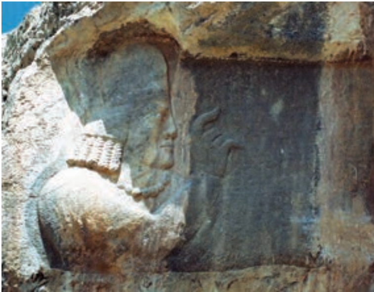
نقش برجسته کرتیر، موبد معروف دوره ساسانی در نقش رجب (استان فارس)

نفوذ زیادی داشتند. در جامعه طبقاتی، رفتن از طبقه‌ای به طبقه دیگر بسیار سخت و تقریباً ناممکن بود؛ یعنی فرزند کشاورز می‌بایستی تا ابد کشاورز بماند. همچنان که اشراف زادگان همیشه در گروه اشراف می‌ماندند. افراد از طبقه محروم نمی‌توانستند با بزرگان ازدواج کنند. لباس و مسکن طبقات نیز متفاوت بود. در شهرها پیشه‌وران و کشاورزان نمی‌توانستند در محله خاص بزرگان سکونت کنند و به ناچار در حومه شهرها ساکن می‌شدند. در دوره ساسانی طبقات مختلف حتی آتشکده*های جداگانه‌ای داشتند. این وضع طبقاتی بر روابط، آداب و معاشرت مردم نیز تأثیر گذاشته بود. در چنین شرایطی بود که مردم سخت کوش و حق طلب ایران، از دین اسلام استقبال کردند و مسلمان شدند، زیرا در این دین انسان‌ها در برابر خدا با هم برابرند و تنها کسانی که درستکار هستند و تقوای بیشتری دارند، نزد خدا گرامی تر هستند.