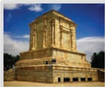
آرامگاه فردوسی، خراسان رضوی

واژه‌ها: بازار = رونق و شکوه، مایهٔ عظمت دیو = اهریمن بازرگان بچه = فرزند بازرگان پور = پسر شد با درم = پول را برگرداند