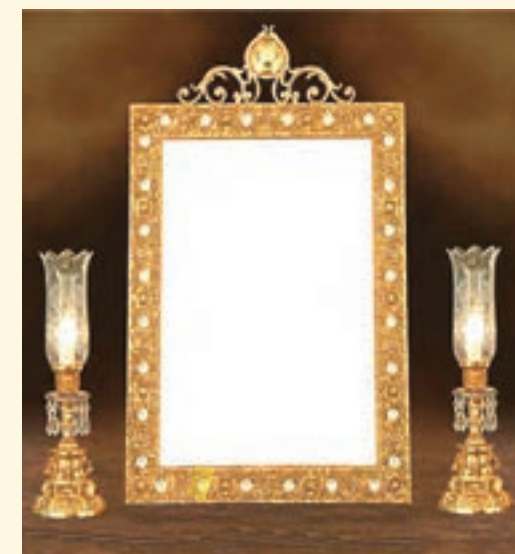
استفاده از آینه و شمعدان در مراسم ازدواج یکی از رسوم به جامانده از ایران باستان است. در آن دوره در مراسم ازدواج از آینه به عنوان نماد راستی و صداقت در زندگی مشترک استفاده می‌کردند.

۶ خانواده‌ها همچنین مرکز تربیت و آموزش بودند و اصول و ارزش‌های اخلاقی چون راستگویی، امانت داری، میهن دوستی و وفای به عهد و پیمان را به اعضای خانواده خود می‌آموختند. پدران، شغل خود را به پسران یاد می‌دادند همچنان که مادران به عنوان کدبانوی خانواده، رسوم خانه‌داری را به دختران آموزش می‌دادند.