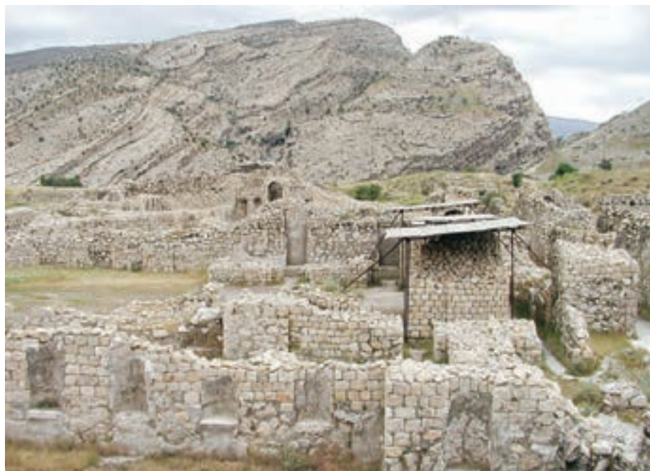
بقایای شهر بیشاپور در نزدیکی کازرون، استان فارس

در این شهرها علاوه بر مأموران حکومتی، صنعتگران، بازرگانان و پیشه‌وران نیز زندگی می کردند.