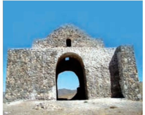
بقایای آتشکده بازه هور، راه مشهد به تربت حیدریه، از آتشکده های دوره