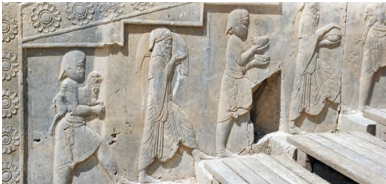
نقش برجسته خدمتکاران در تخت جمشید، استان فارس

در ایران باستان، مالیات، منبع اصلی درآمد حکومت‌ها بود که به صورت نقدی یا جنسی دریافت می‌شد. بیشترین حجم مالیات را کشاورزان می‌پرداختند. دامداران به نسبت تعداد دام‌هایشان و پیشه‌وران و بازرگانان نیز به میزان کالا و خدماتی که عرضه می‌کردند، مالیات می‌دادند. علاوه بر اینها، نوع دیگری از مالیات به نام مالیات سرانه وجود داشت که فقط از عامه مردم وصول می‌شد و بزرگان و اشراف از پرداخت آن معاف بودند. همچنین در جشن‌ها و مراسم به تخت نشستن شاهان، بزرگان و عامه مردم هدایایی را به پادشاه پیشکش می‌کردند. مأموران مالیاتی معمولاً نسبت به مردم سخت‌گیری و ستم می‌کردند و بیش از آنچه مقرر شده بود، طلب می‌نمودند. گاهی به دلیل خالی بودن خزانه، میزان مالیات‌ها را افزایش می‌دادند. البته در مواقعی نیز به سبب جلوگیری از شورش مردم و یا بروز خشکسالی، فشار برای گرفتن مالیات کمتر می‌شد.