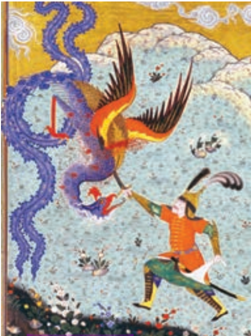
نقاشی سبک شاهنامه‌ای که نبرد اسفندیار با سیمرغ را نشان می‌دهد.

از دیرباز مردم ایران به ورزش‌های رزمی و پهلوانی چون کشتی علاقه‌مند بوده‌اند و پهلوان و پهلوانی در تاریخ کهن ما ریشه دارد.