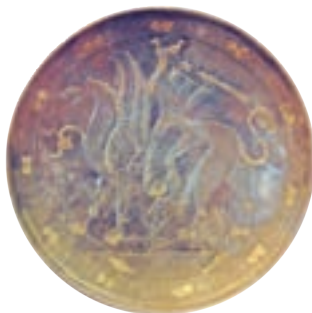
بشقاب زرین متعلق به دوره ساسانی