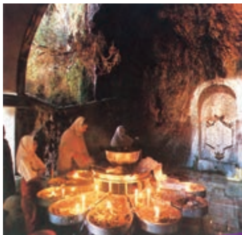
زیارتگاهی در استان یزد از مکان‌های مقدس زرتشتیان