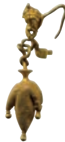
گوشواره طلایی متعلق به دوره اشکانی