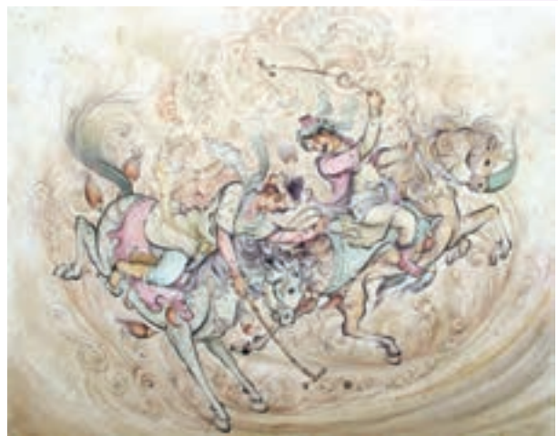
نقاشی خرد نگاره (مینیاتور) از چوگان