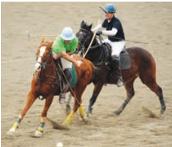
تصویری از بازی چوگان در ایران امروز