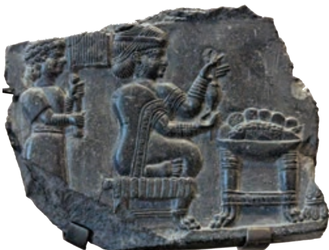
سنگ‌نگاره زن ایلامی در حال نخ‌ریسی

ایرانیان، از نخستین کسانی بودند که شلوار را طراحی کردند و پوشیدند. شلوار و بالاپوش‌های آستین‌دار و کلاه نم‌دی پوشاک اصلی مردان بود. زنان نیز از شلوار، پیراهن‌های بلند و نوعی سربند استفاده می‌کردند. لباس‌های ایرانی مورد توجه بزرگان و درباریان روم و یونان بود و اغلب سعی می‌کردند از طرح لباس‌های ایرانی تقلید کنند. ۱۴