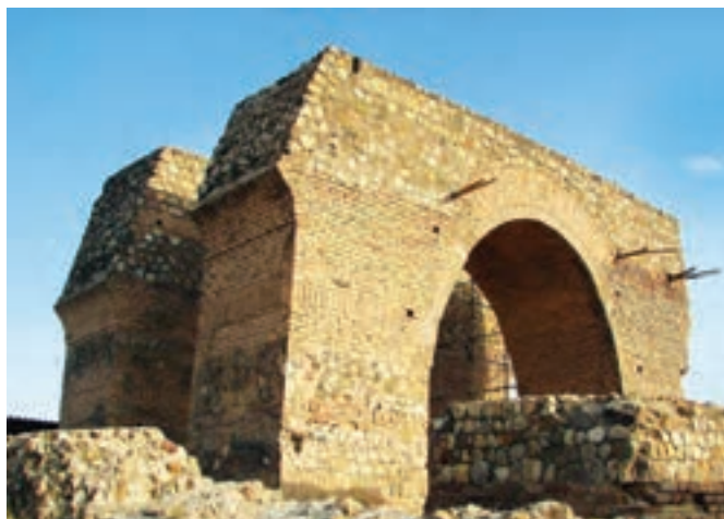
بقایای آتشکده تپه میل، جاده ری - ورامین - تهران