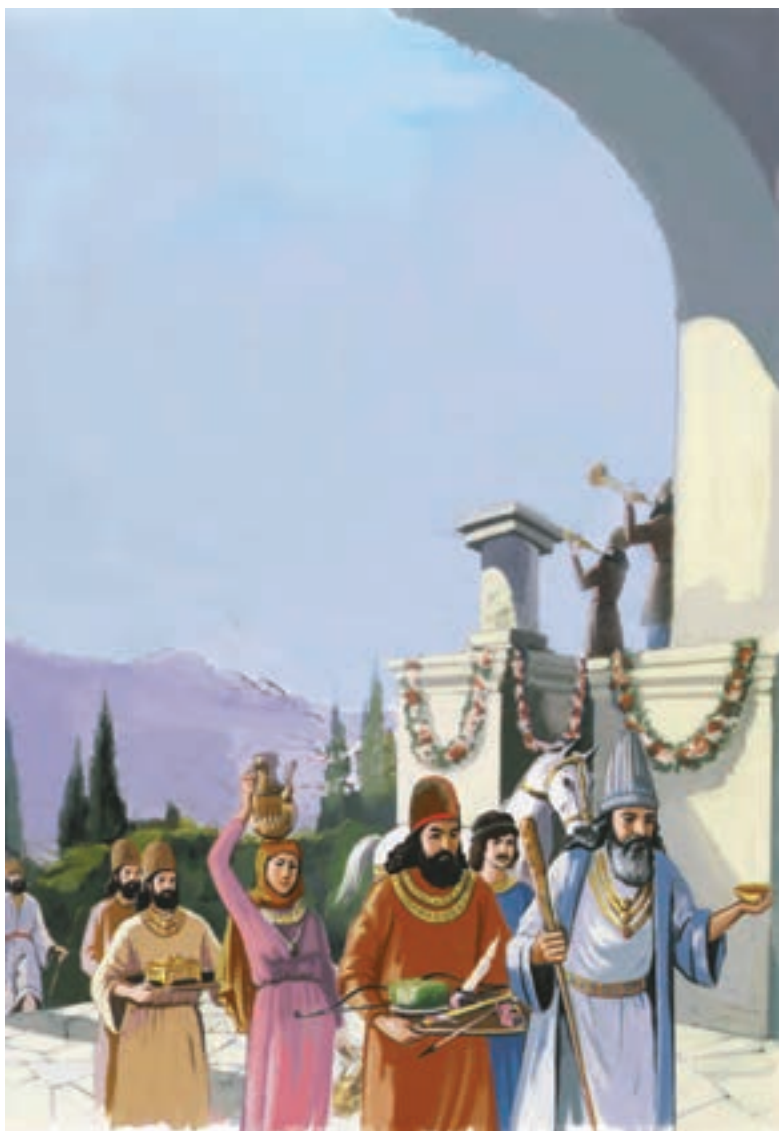
نقاشی هدیه‌آوران جشن نوروز در تخت جمشید

آیا می‌توانید با توجه به آنچه در سال گذشته خواندید بگویید این جشن، علاوه بر ایران در کدام کشورهای همسایه نیز برپا می‌شود؟ چرا؟