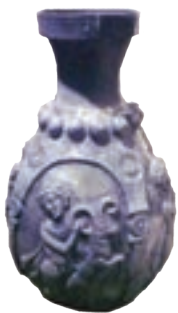
تنگ نقره ای ساسانی