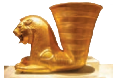
ریتون* (تکوک) شیر غزان هخامنشی