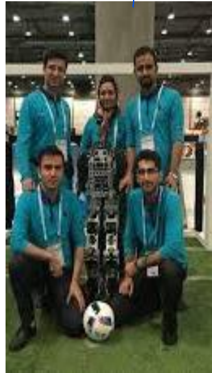
گروه تیم رباتیک