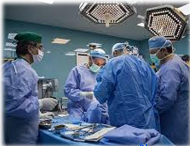
تیم جراحی: (سلامتی بیماران)