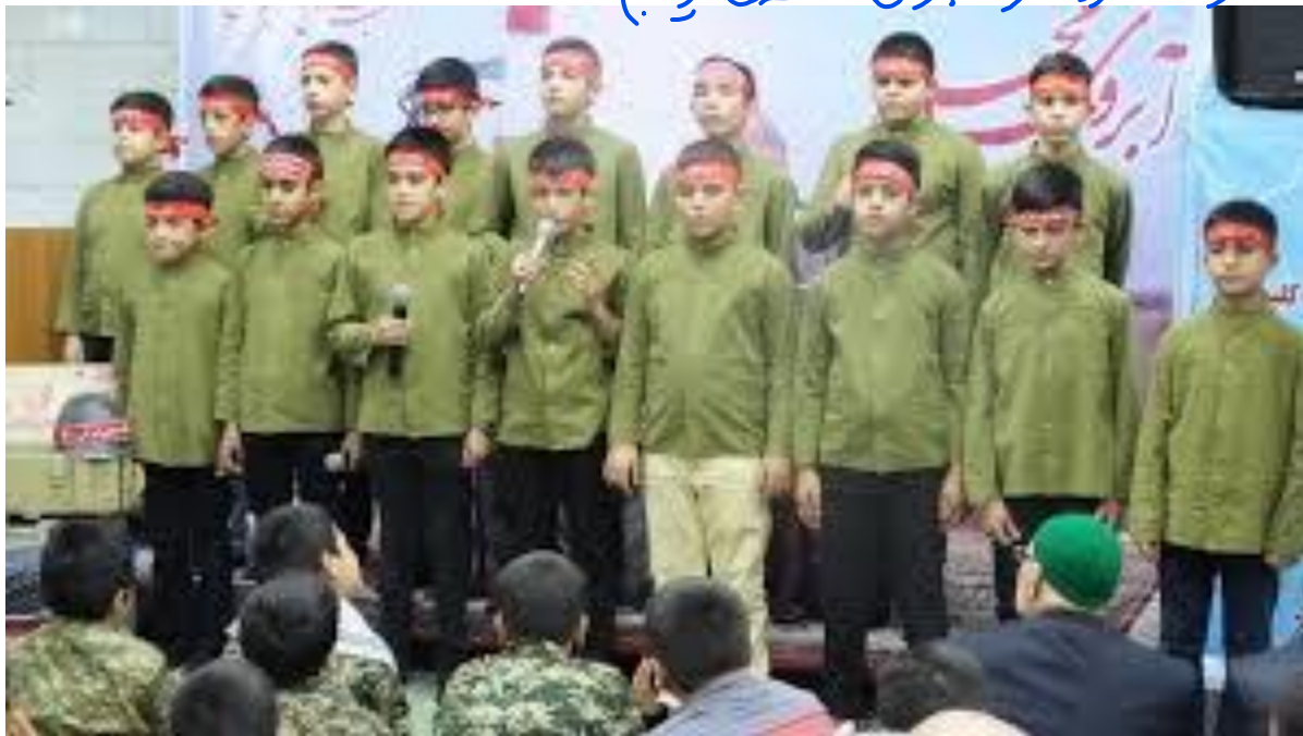
گروه سرود: (اجرای قطعی زیبا)