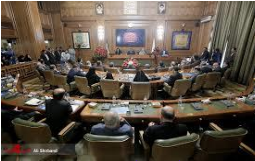
شورای شهر تهران