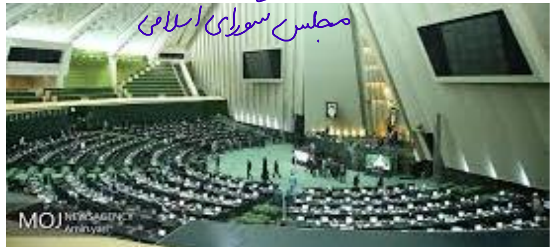
مجلس شورای اسلامی