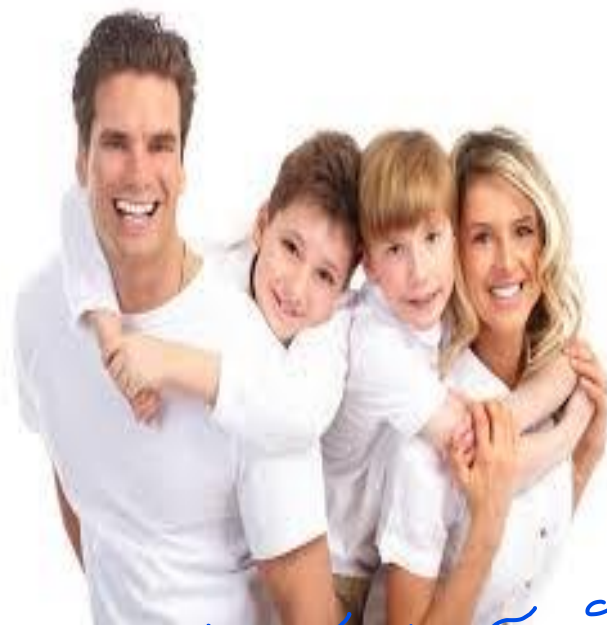
خانواده: زندگی با آرامش و آسایش