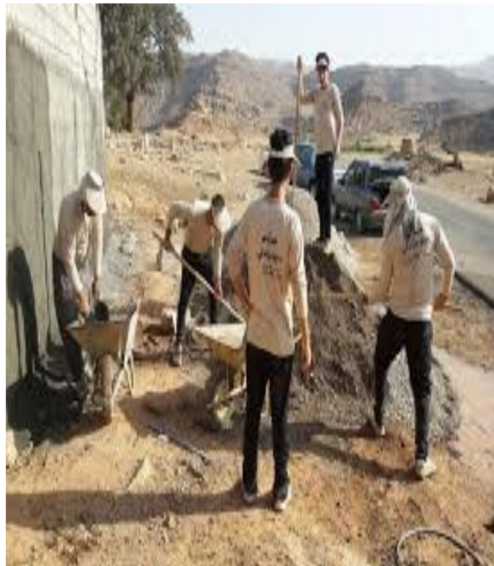
گروه جهادی: (سازندگی و آبرارانی)