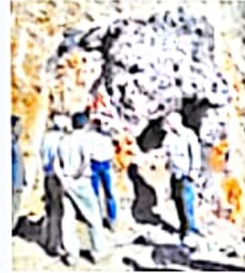
▲ معدن سنگ آهن بافق، یزد