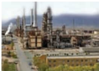
▲ کارخانه‌ی پتروشیمی، سازند اراک

● صنایع پتروشیمی : کارخانه‌های پتروشیمی، نفت و گاز را به