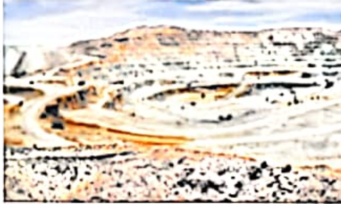
▲ معدن مس سرچشمه‌ی کرمان از بزرگ‌ترین معادن مس دنیاست.

صنایع مادر برای تولید کالا به مواد اولیه نیاز دارند. آنها این مواد اولیه را از «معادن‌ها» تأمین می‌کنند. کشور پهناور ما ایران معادن فراوانی دارد. معدن نعمتی خدادادی است.