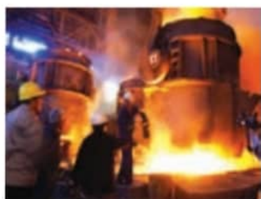
▲ کارخانه‌ی ذوب آهن، اصفهان

در کوره‌های بسیار داغ ذوب می‌گردد و به آهن تبدیل می‌شود.