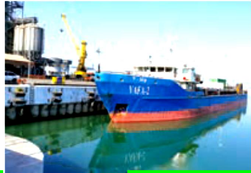
بندر امیرآباد - مازندران