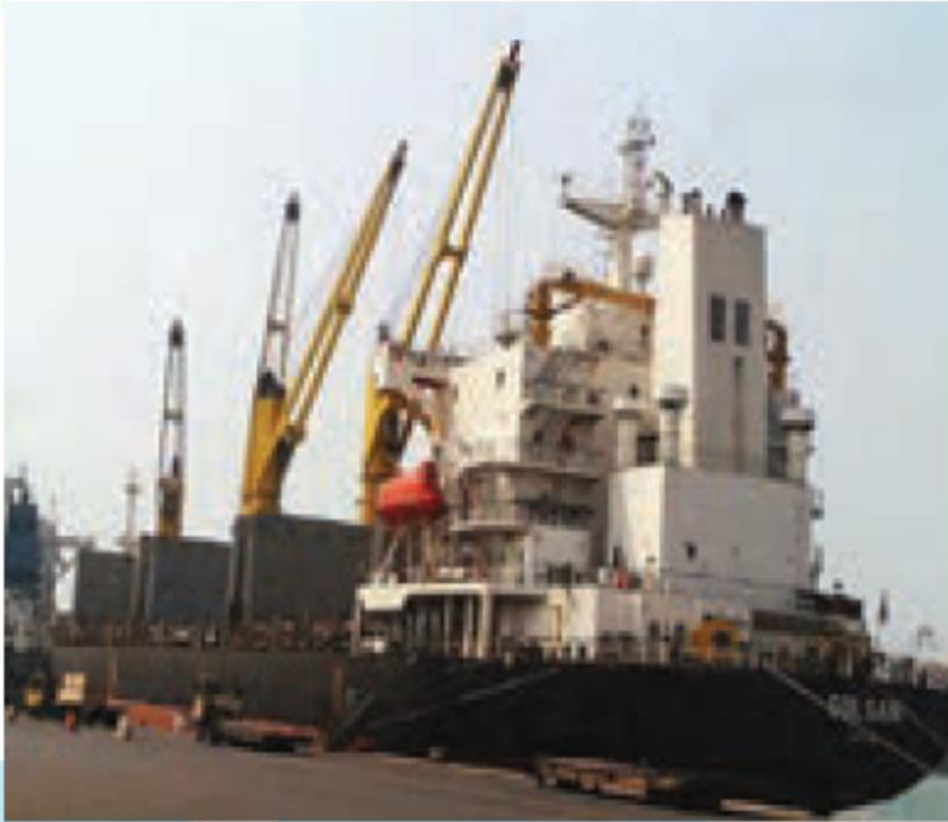
کشتی در حال بارگیری - بندر چابهار، سیستان و بلوچستان

بخش عمده‌ی صادرات و واردات کشور ما از طریق بندرها و به وسیله‌ی کشتی صورت می‌گیرد. بندر جایی در کنار دریاست که کشتی‌ها در آنجا توقف و بارگیری می‌کنند یا بار خود را تخلیه می‌کنند.