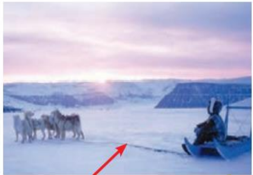
اسکیمو و سورتمه، قطب شمال

۱- متن صفحه‌ی قبل را بخوانید و کاربرگ‌های شماره‌ی ۱۲ را انجام دهید.