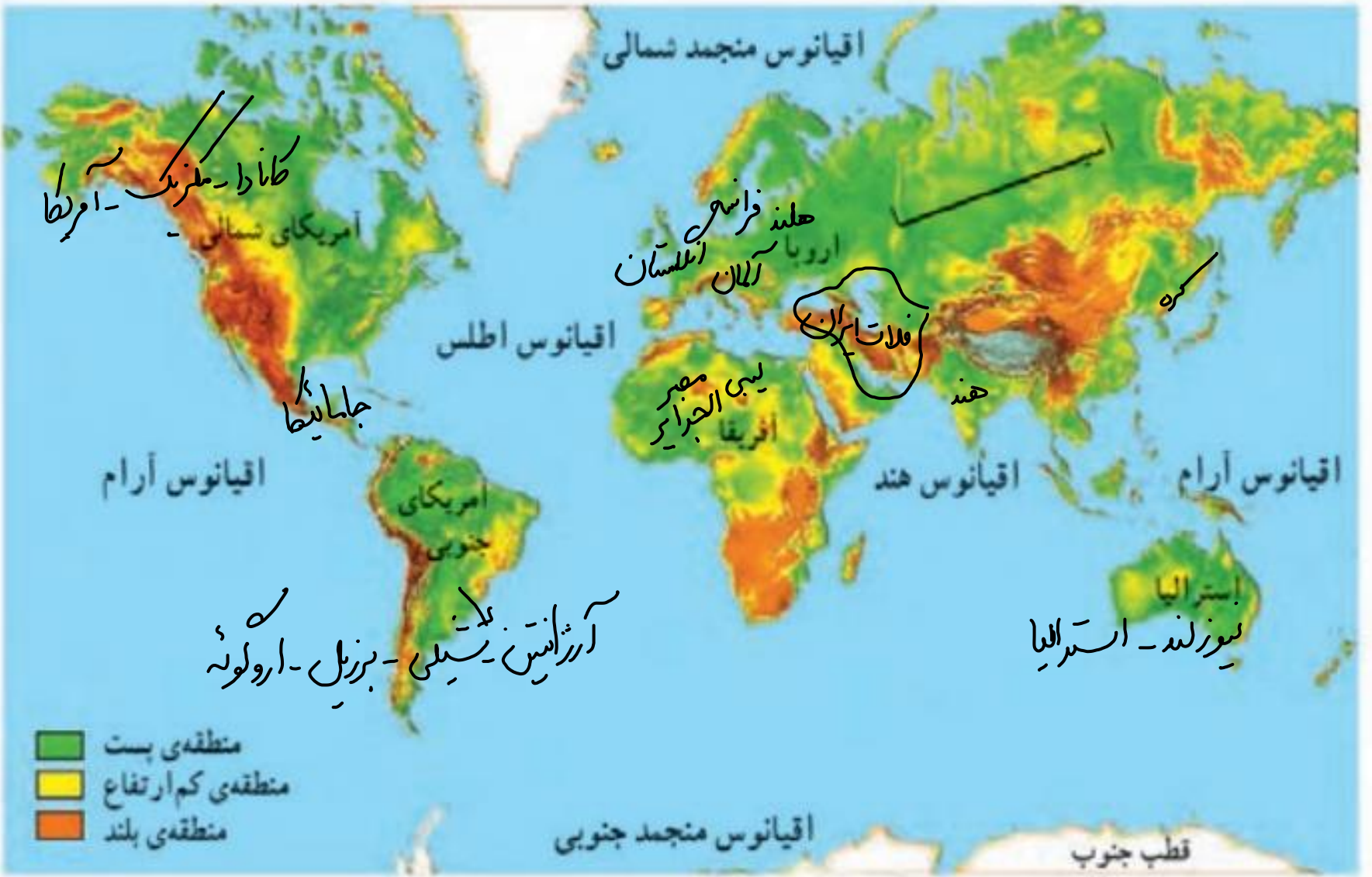
نقشه‌ی قاره‌های جهان