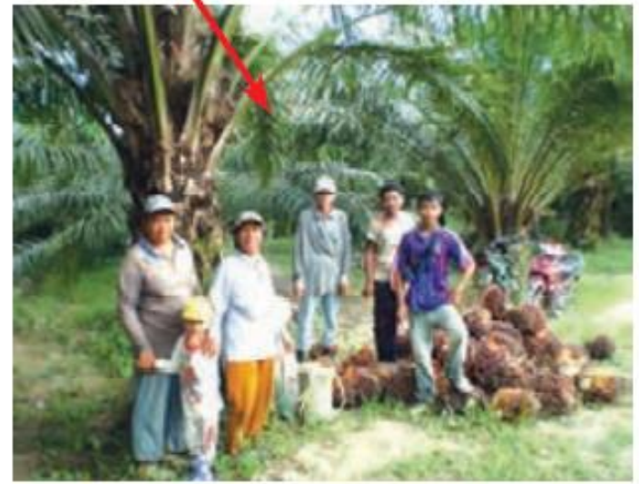
برداشت محصول از درختان پالم، جنگل های استوایی مالزی