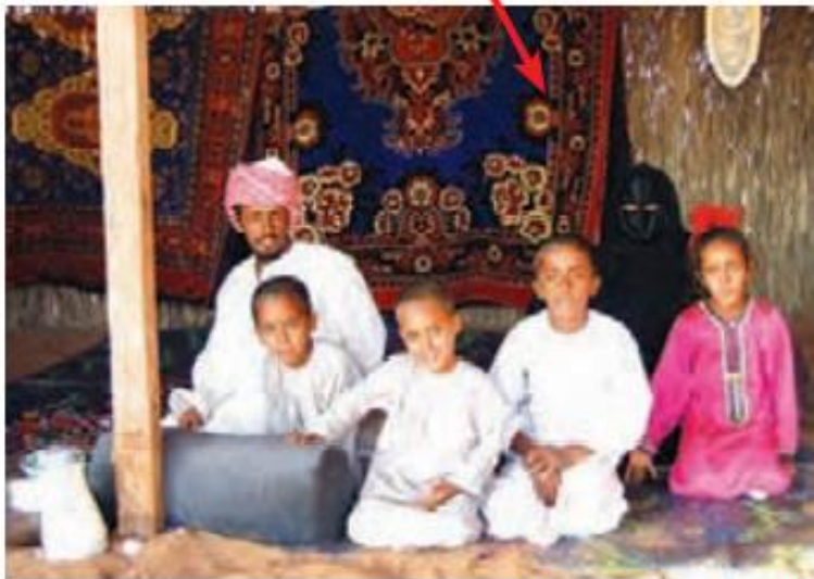
زندگی قبیله ای، بیابان عربستان