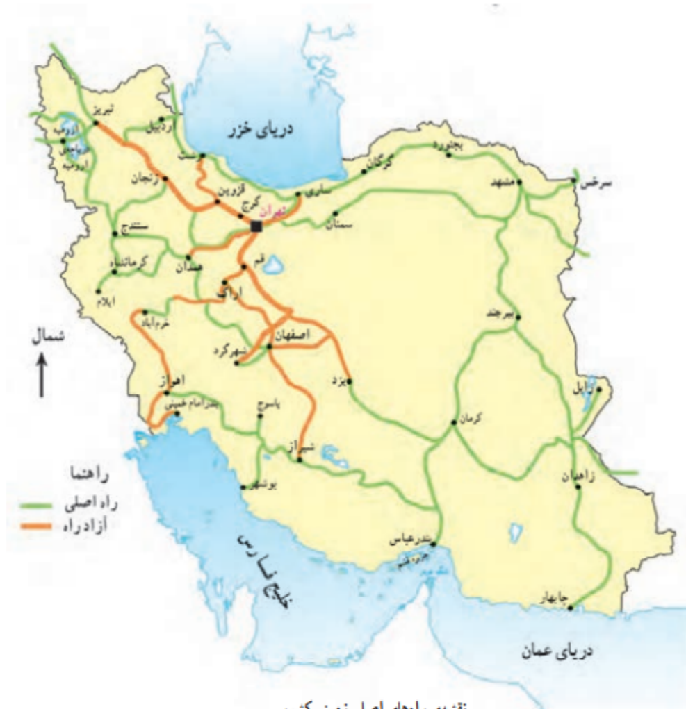
نقشه‌ی راه‌های اصلی زمینی کشور