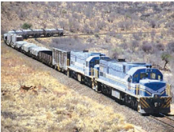
▲ حمل کالا از طریق قطار باربری