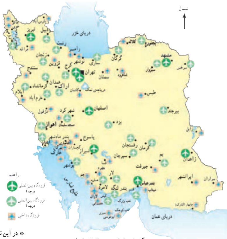
نقشه‌ی فرودگاه‌های داخلی و بین‌المللی ایران

بین‌المللی دارند و پروازهای خارجی از آن فرودگاه‌ها انجام می‌شود.