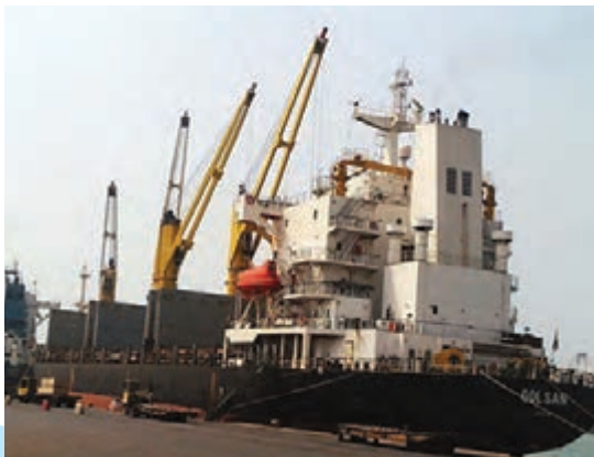
▲ کشتی در حال بارگیری - بندر چابهار، سیستان و بلوچستان

بخش عمده‌ی صادرات و واردات کشور ما از طریق