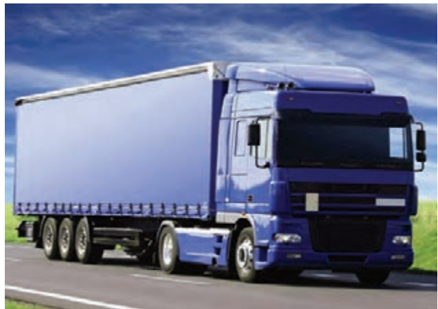
▲ حمل کالا از طریق جاده