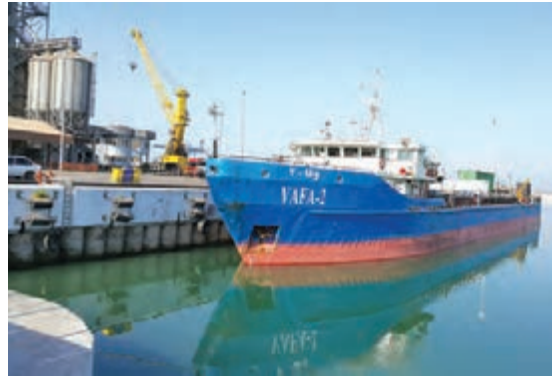
▲ بندر امیرآباد - مازندران