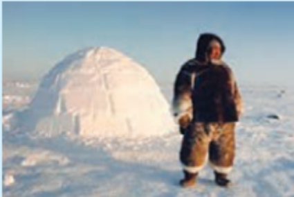
اسکیمو و خانه‌ی برفی (ایگلو)

در نزدیکی قطب شمال در سرزمین‌های مجاور سیبری، آب و هوا بسیار سرد است. در این ناحیه، اسکیموها زندگی می‌کنند.