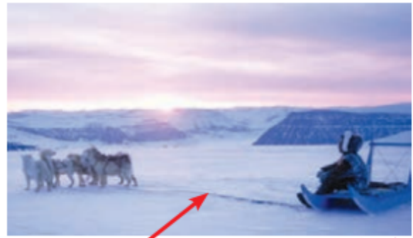
▲ اسکیمو و سورتمه، قطب شمال