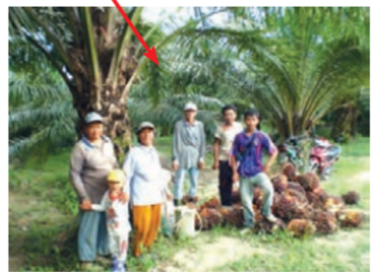
▲ برداشت محصول از درختان پالم، جنگل‌های استوایی مالزی