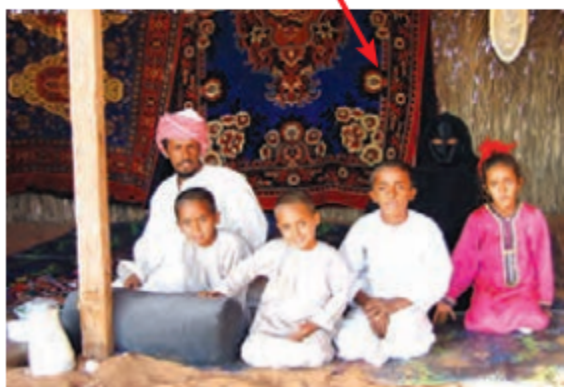
▲ زندگی قبیله‌ای، بیابان عربستان