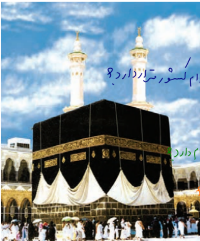
▲ خانه‌ی کعبه - مسجد الحرام

پدر پاسخ داد: «بله. ما به کشور عربستان رفتیم. در فرودگاه جده پیاده شدیم و به سمت مکه، حرکت کردیم. تمام راه بیابان بود. مکه و مدینه، مهم‌ترین شهرهای مقدس مسلمانان جهان، در کشور عربستان قرار دارند». مهم‌ترین شهر مسلمانان حبیث و درله ام لسور متر از دار دارد ۸ برادر سارا پرسید: «چرا مکه شهری مقدس است؟» پدر توضیح داد: «چون خانه‌ی کعبه در این شهر است. خانه‌ی کعبه در مسجد الحرام قرار دارد که بزرگ‌ترین و مهم‌ترین مسجد دنیاست. بزرگترین مسجد دنیا نام دارد ۸» خانه‌ی کعبه قبله‌ی مسلمانان جهان است و ما هر روز به سمت آن نماز می‌خوانیم. قبله‌ها مسلمانان پجاس ۸ در هنگام حج، ما خانه‌ی کعبه را طواف می‌کنیم؛ یعنی به دور آن می‌گردیم».