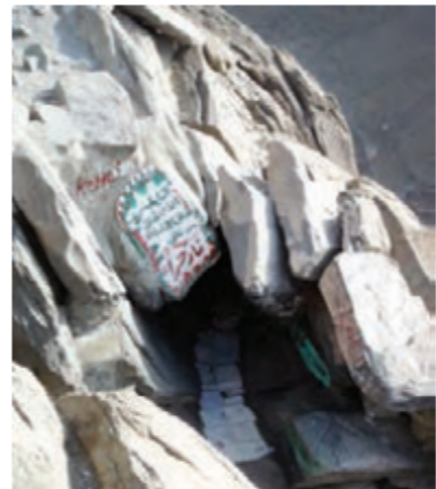
▲ غار حرا

حضرت محمد (ص) پس از بعثت، مأموریت یافت که مردم را پنهانی به دین اسلام دعوت کند. او مدت سه سال فقط خویشاوندان و آشنایان را به صورت مخفیانه به دین اسلام دعوت می‌کرد. جالب است بدانید زمانی که تعداد مسلمانان زیادتر شد، آنها برای انجام عبادت و دیدار یکدیگر به دژه‌ها و کوه‌های اطراف مکه می‌رفتند. بعد از سه سال، خداوند به پیامبر مأموریت داد تا همه‌ی مردم را آشکارا به اسلام دعوت کند.