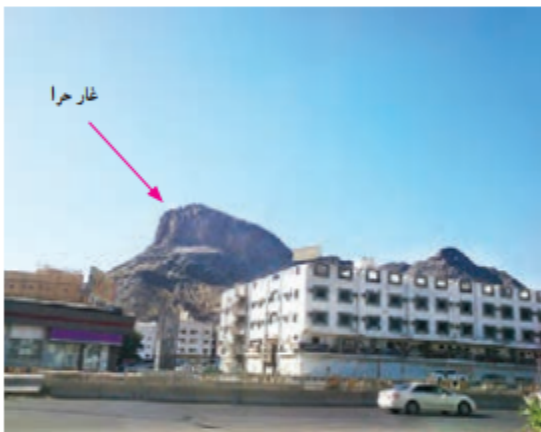
▲ منظره‌ی غار حرا در اطراف شهر مکه

اسلام، حضرت محمد (ص)، برای راز و نیاز با خدا به این غار می‌رفت. در همین غار بود که از طرف خداوند به پیامبری مبعوث شد. پیامبر را چرا مبعوث کردند؟