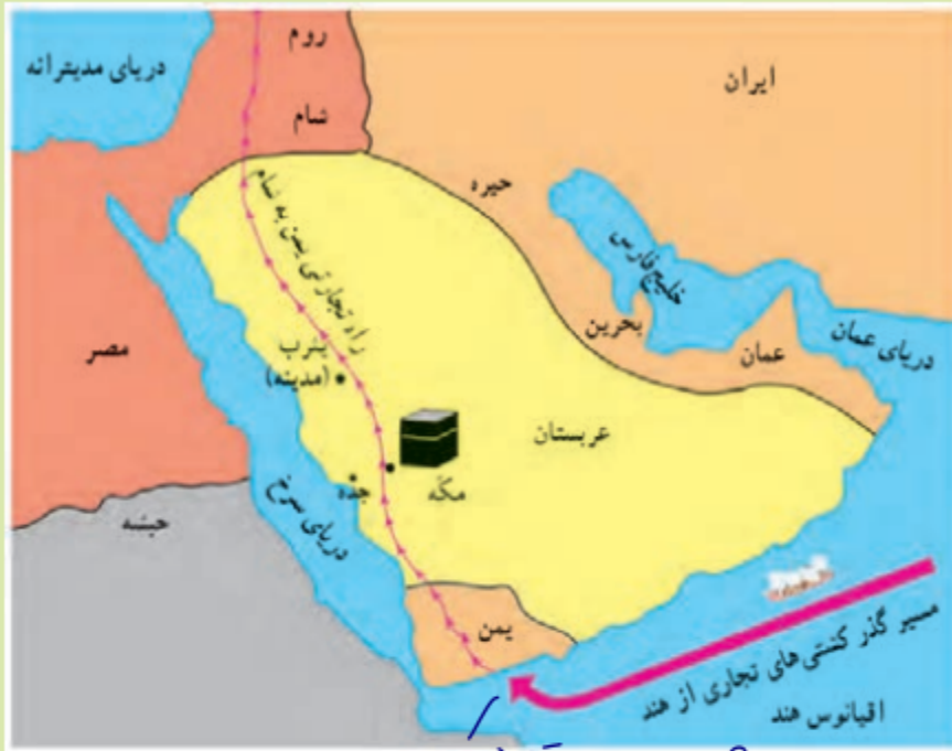
نقشه‌ی شماره‌ی ۱ شبه جزیره را اقلیت لیند.

به سرزمینی که از سه طرف به آب و از یک طرف به خشکی راه داشته باشد، شبه جزیره می‌گویند. در زمان ظهور اسلام، مهم‌ترین شهر عربستان مکه بود؛ زیرا این شهر بر سر راه کاروان‌های بازرگانی قرار داشت و خانه‌ی کعبه نیز در آن جا بود. چرا همه مهم‌ترین شهر عربستان است؟