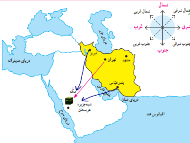
نقشه‌ی شماره‌ی ۲

همه‌ی ما مسلمانان رو به قبله نماز می‌خوانیم. قبله‌ی ما خانه‌ی کعبه در مکه است. چون کشور عربستان در جنوب غربی ایران قرار دارد، ما در هر جای ایران که باشیم، اگر جهت جنوب غربی را پیدا کنیم، رو به قبله ایستاده‌ایم.