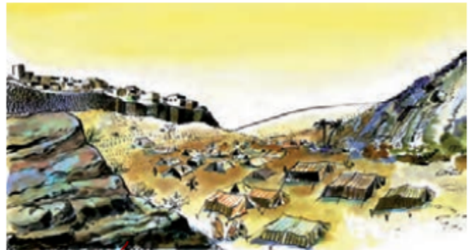
۸ تصویر شعب آبی طالب در زمان محاصره