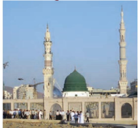
▲ مسجد النبی، نمای بیرونی