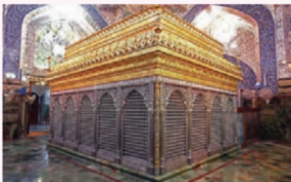
۸ مرقد مطهر حضرت علی (ع)

پس از شکست سخت خوارج در جنگ نهروان، یکی از آنها مأمور کشتن حضرت علی (ع) شد. او که ابن‌ملجم نام داشت، در سحرگاه روز ۱۹ رمضان سال چهارم هجری، هنگامی که حضرت علی (ع) در مسجد کوفه مشغول خواندن نماز صبح بود، با شمشیر زهرآلود خود ضربه‌ای به سر آن حضرت زد. حضرت علی (ع) دو روز بعد، در ۲۱ رمضان به شهادت رسید.