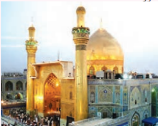
△ حرم حضرت علی (ع)، شهر نجف

پس از کشته شدن عثمان، مسلمانان با خواهش و اصرار از حضرت علی (ع) خواستند که خلافت را بپذیرد و با اشتیاق با حضرت علی (ع) بیعت کردند. حضرت علی (ع) شهر کوفه را که در عراق قرار داشت مرکز خلافت خود قرار داد. آن حضرت همانند محرومان و مستضعفان زندگی ساده‌ای داشت؛ برای اجرای عدالت تلاش می‌کرد و دست ستمگران را از بیت‌المال کوتاه کرد. به همین دلیل، با شروع خلافت حضرت علی (ع) و آشکار شدن شیوه‌ی حکومت او، برخی از سودجویان بیعت خود را شکستند و به مخالفت و جنگ با آن حضرت پرداختند اما سرانجام، شکست خوردند.