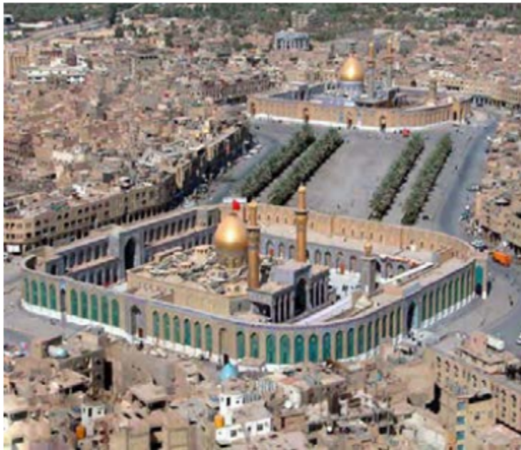
۸ بین الحرمین کربلا، حرم امام حسین(ع) و حضرت ابوالفضل(ع)

امام حسین (ع) و یاران بزرگوارش تا آخرین نفس شجاعانه جنگیدند. دلاوری آنان در این جنگ، در تاریخ جهان بی نظیر است. آن حضرت در مورد دلیل قیام خود فرموده اند: