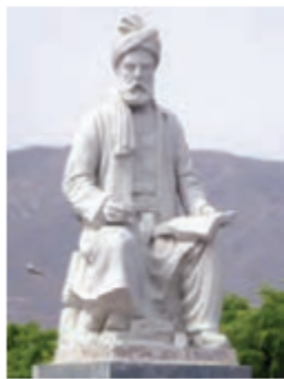
▲ فردوسی شاعر بزرگ ایرانی

از جمله شاعران ایرانی معروف دوره‌ی غزنویان، ابوالقاسم فردوسی است. آیا نام اثر معروف او را می‌دانید؟ سَهْمَنَسَی نَرْدَوَس