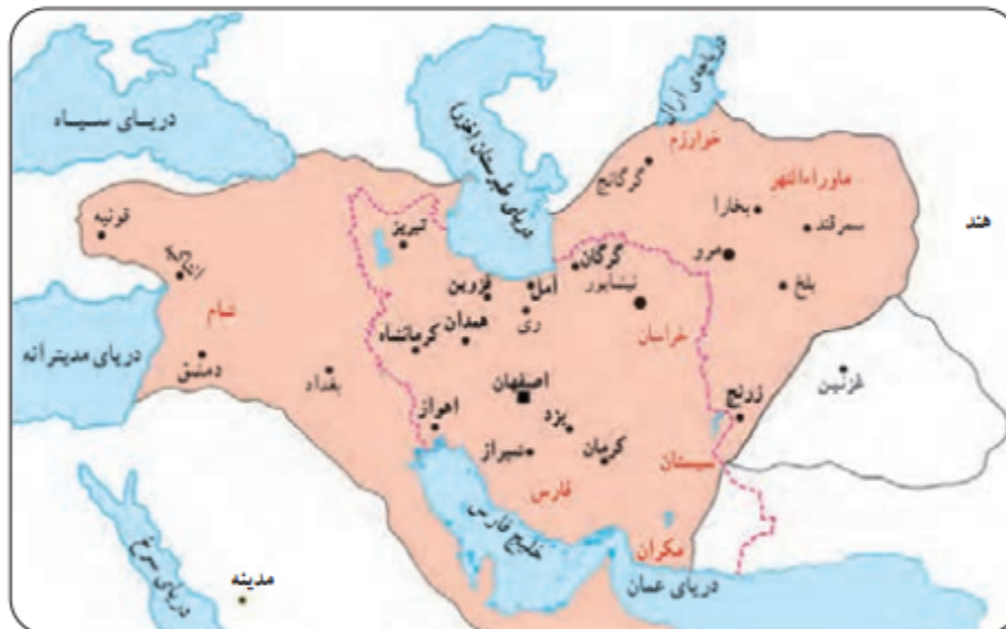
■ پایتخت - - - - مرزهای ایران کنونی قلمرو سلجوقیان