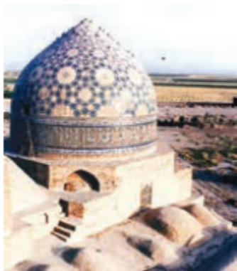
▲ مسجد جامع سامره

● در این دوره، همچنین مساجد، برج‌ها، مناره‌ها و کاروانسراهای باشکوهی بنا شدند.