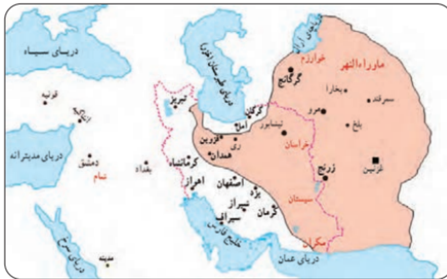
■ پایتخت - - - - مرزهای ایران کنونی قلمرو غزنویان