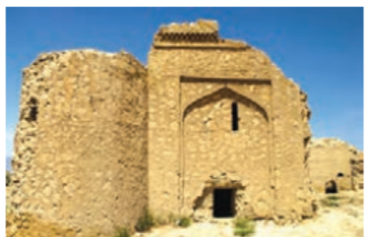
▲ بقایای کاروانسرای رباط قره عشق، خراسان شمالی