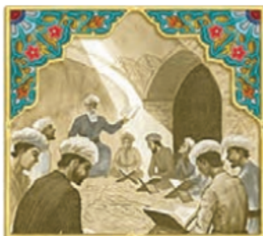
▲ تصویر مدرسه‌ی نظامیه

از جمله شاعران ایرانی معروف دوره‌ی غزنویان، ابوالقاسم فردوسی است. آیا نام اثر معروف او را می‌دانید؟ سَهْمَنَسَی نَرْدَوَس