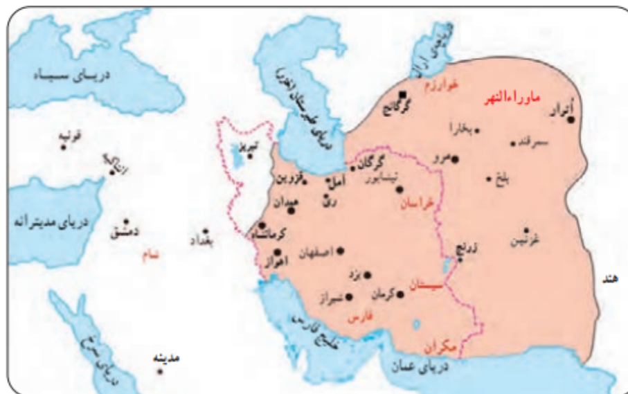
■ پایتخت - - - - مرزهای ایران کنونی قلمرو خوارزمشاهیان