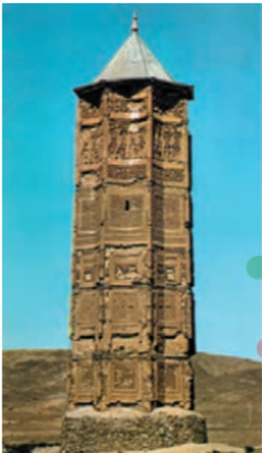
مناره‌ی دوره‌ی غزنویان غزنین، افغانستان