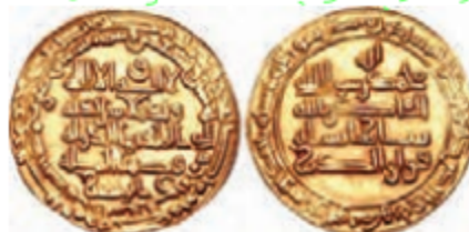
▲ سکه‌های دوره‌ی ایلخانان