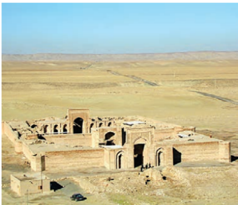
▲ کاروان‌سرای شرف در نزدیکی سرخس، استان خراسان رضوی

در زمان جانشینان چنگیز، هلاکو و تیمور، مردم ایران به تدریج، ویرانه‌ها را به شهرهایی آباد و پررونق تبدیل کردند و شهرنشینی را در ایران گسترش دادند. در این شهرها بناهای زیادی چون مساجد، کاروان‌سراها، حمام‌ها و برج‌ها ساخته شد.