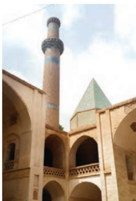
▲ مسجد جامع نطنز