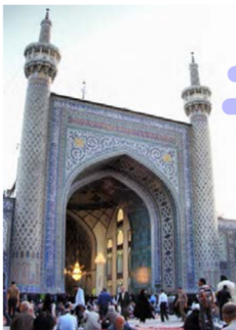
▲ مسجد گوهرشاد، مشهد

مسجد گوهرشاد در کجا و به همت چه کسی ساخته شد؟