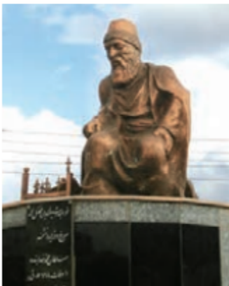
▲ خواجه رشیدالدین فضل‌الله همدانی