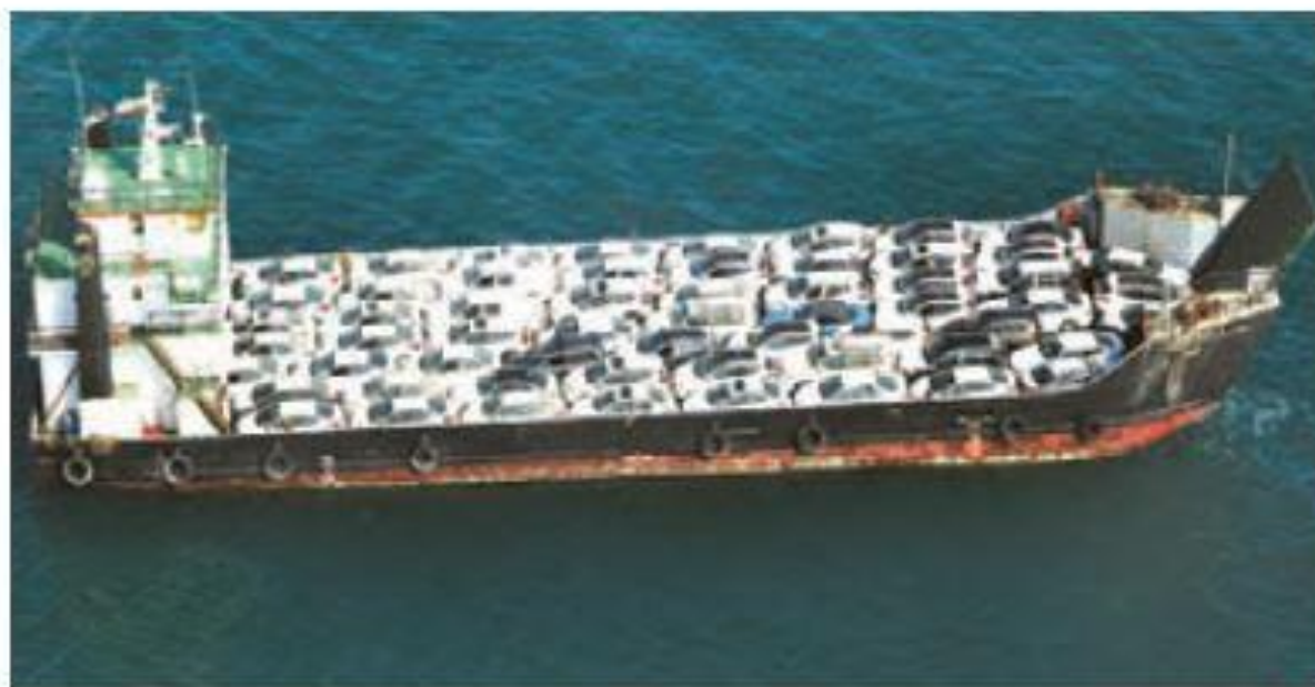
▲ کشتی در حال حمل خودرو - بندر عباس، هرمزگان

حمل و نقل با کشتی و از راه دریا بسیار ارزان است. کشتی‌ها برای حمل کالاهای سنگین، بسیار مناسب‌اند ولی خیلی آهسته حرکت می‌کنند. علاوه بر این، همه‌ی کشورها به دریا دسترسی ندارند.