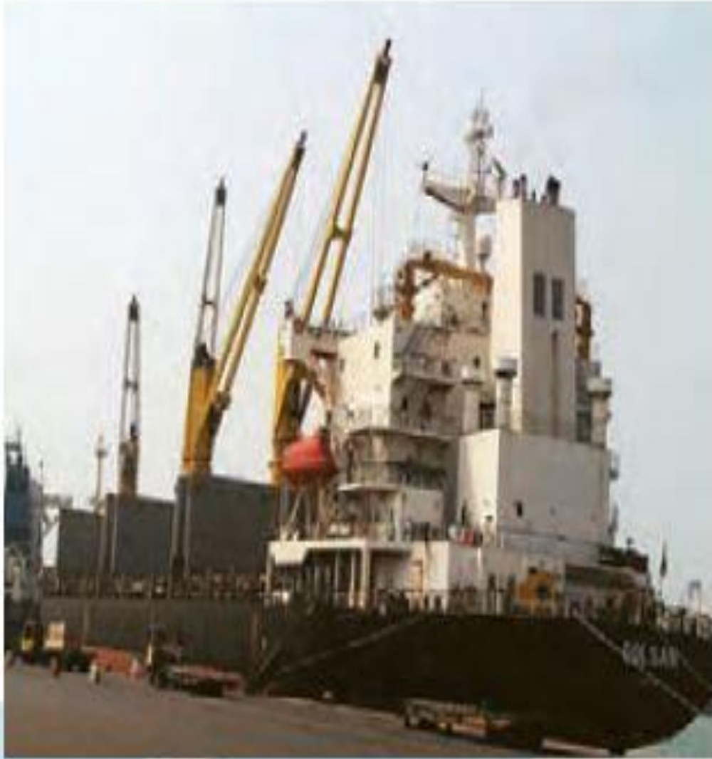
▲ کشتی در حال بارگیری - بندر چابهار، سیستان و بلوچستان

بخش عمده‌ی صادرات و واردات کشور ما از طریق بندرها و به وسیله‌ی کشتی صورت می‌گیرد. بندر جایی در کنار دریاست که کشتی‌ها در آنجا توقف و بارگیری می‌کنند یا بار خود را تخلیه می‌کنند.