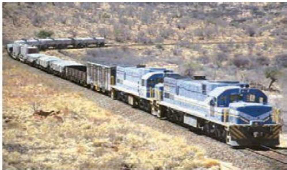
حمل کالا از طریق قطار باربری