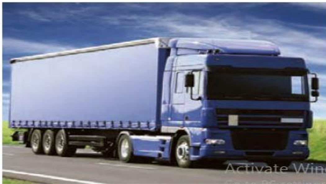
حمل کالا از طریق جاده

Activate Windows Go to PC settings to activate Windows