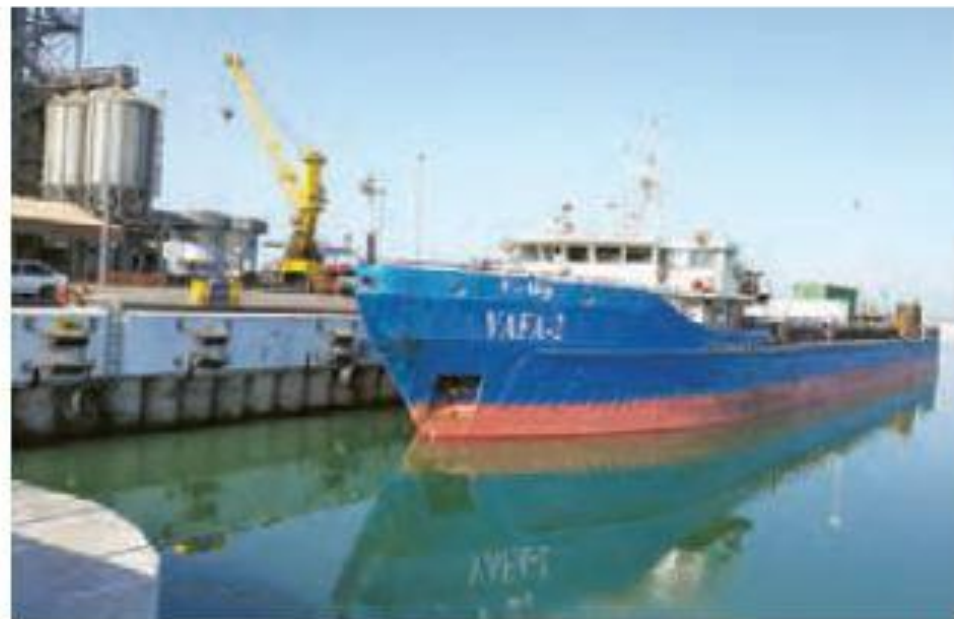
▲ بندر امیرآباد - مازندران