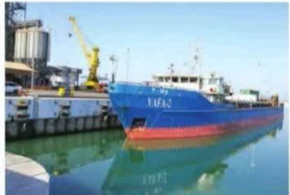
▲ بندر امیرآباد - مازندران