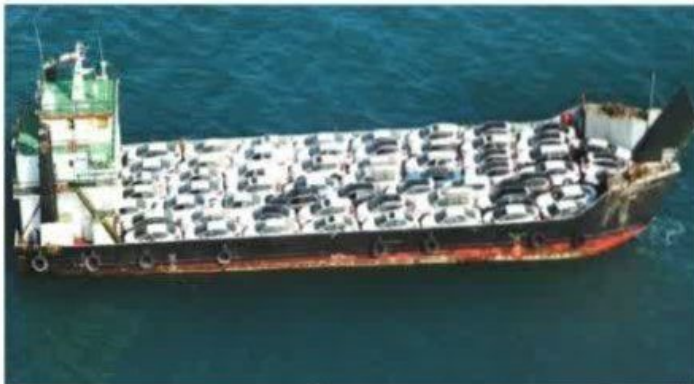
▲ کشتی در حال حمل خودرو - بندر عباس، هرمزگان

معایب (ولی خیلی آهسته حرکت می‌کنند. علاوه بر این، همه‌ی کشورها به دریا دسترسی ندارند)