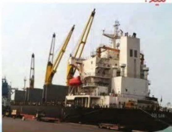
▲ کشتی در حال بارگیری - بندر چابهار، سیستان و بلوچستان